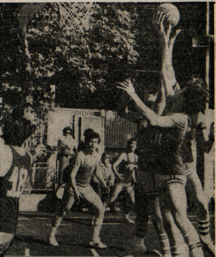
Jadranovi mladinci (med tekmo s Servolano) so doslej igrali s spreminljivo srečo

Pred kratkim smo že poročali, da so v Sloveniji priredili zanimiv sgoriski tek na Kravace. Zdjaj pa vse kaže, da se bo ta vrsta rekreacije razvila v Sloveniji prav tako, kot se je že splošno znani trki, ki so v Sloveniji priredili zanimiv sgoriski tek na Kravace.