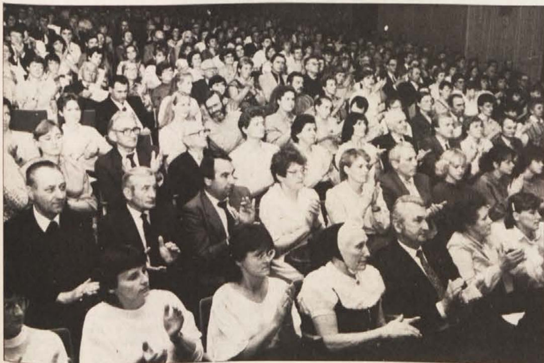
Die Theater und Literatur-Abende wurden von einer großen Zahl Kulturinteressierter besucht.