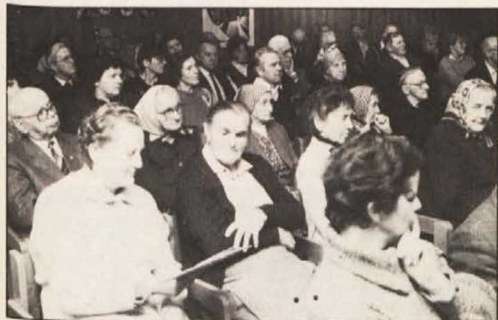
Številni poslušalci so z zanimanjem sledili predavniku dr. Walzla.

Vemo, da je bil za izvedbo teh načrtov odgovoren Maier-Kaibitsch, ki je vplival tudi na usodo Slovencev južno od Karavank.