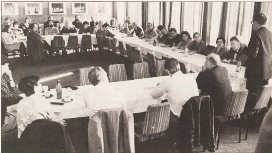
Am internationalen Simposium zum Thema Theater wirkte auch Maja Haderlap mit.

Am westlichen Ende der „Schilleranlagen“, eines kleinen Parks mit Linden und Buchen, unter denen sich Sandwege hinziehen, des lausitzer Städtchens Bautzen (sorbisch Budyšin) steht ein sehr schönes modernes Theater. Es ist recht reichlich zehn Jahre alt und heißt „Deutsch-sorbisches Volkstheater“. Das alte Haus dieser Berufsbühne, das weiter im Zentrum der Stadt gestanden hatte, mußte wegen hoffnungsloser Baufälligkeit abgerissen werden. Fremde Besucher des heutigen Theaters, selbst die einheimischen deutschen und sorbischen, sind sich beim Betreten des Hauses kaum bewußt, welche Bedeutung ein solches Gebäude für ein kleines Volk wie das sorbische hat. Man geht ja auch nicht ins Theater, um über die Geschichte der Institution nachzudenken, sondern, um sich dem theatralischen Vergnügen auf der Bühne hinzugeben.