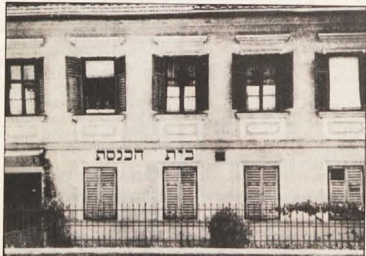
Das ehemalige jüdische Bethaus in der Klagenfurter Platzgasse. An seiner Stelle wurde nunmehr eine Gedenktafel für die jüdischen Mitbürger errichtet.