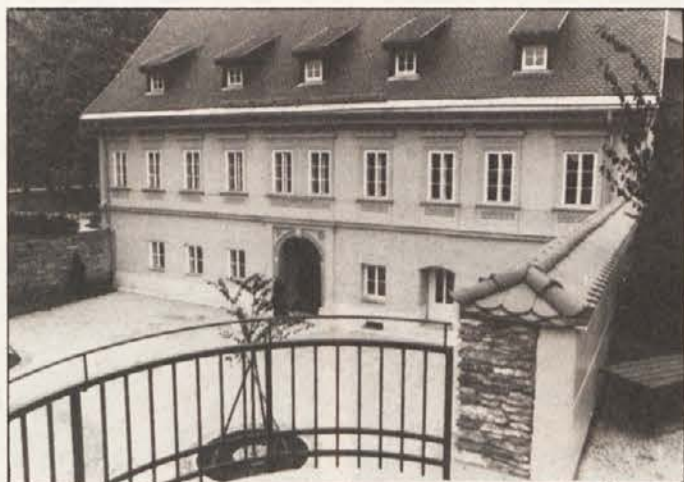
Obnovljeno poslopje v Reitschulgasse 4