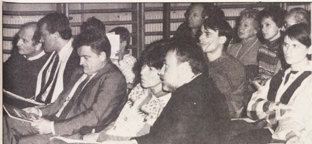
Nad 500 obiskovalcev je prisostvovalo koncertu in podijski diskusiji v Mladinskem domu.

BUDIMPEŠTA. Po zadnji seji madžarske vlade je pravosodni minister dejal, da načrt zakona o združevanju omogoča posameznikom, pravnim osebam in drugim organom, da ustanovijo družbene organizacije in politične stranke. Dodal je, da bo z morebitnim sprejetjem dokumenta parlament na decemberskem zasedanju tako rekoč sprejel možnost uveljavitve večstrankarskega sistema. Če bo parlament to reformo sprejel, je treba z uvedbo računati leta 1990.