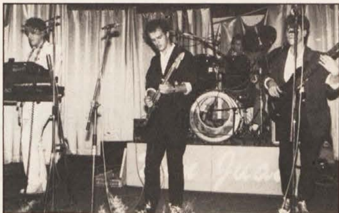
Don Juan je navdušil v Celovcu, Bilčovsu in v Globasnici

CELOVEC – Na celovškem sejamskem razstavišču so v petek odprli tako imenovani center montažnih hiš. Vsi zainteresirani si primere tovrstnih enodružinskih hiš lahko ogledajo od ponedeljka do sobote. Ogled je ugoden tudi zaradi nanovo urejenih parkirišč, ki so v neposredni bližini razstavnega prostora. V razstavljenih hišah prikazujejo tudi dosežke pri proizvodnji stanovanjske opreme.