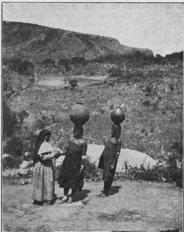
Poganske žene pozdravljajo misijonarko.