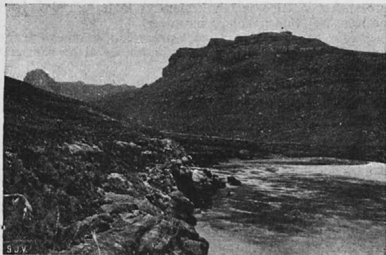
Reka Oranje ob misijonu Betel.