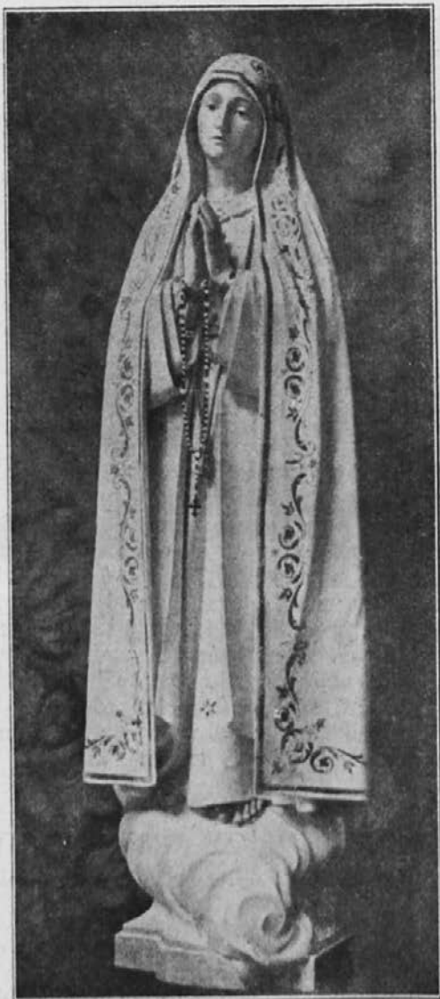
Naša ljuba Gospa iz Fatime, prosí za nas!

Pri vsaki sveti maši si lahko skrajšaš časne kazni za storjene grehe — več ali manj, kakor si pač pobožno navzoč.