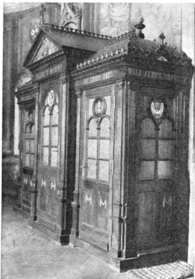
Nova monumentalna spovednica pri Sv. Tomažu pri Ormožu.