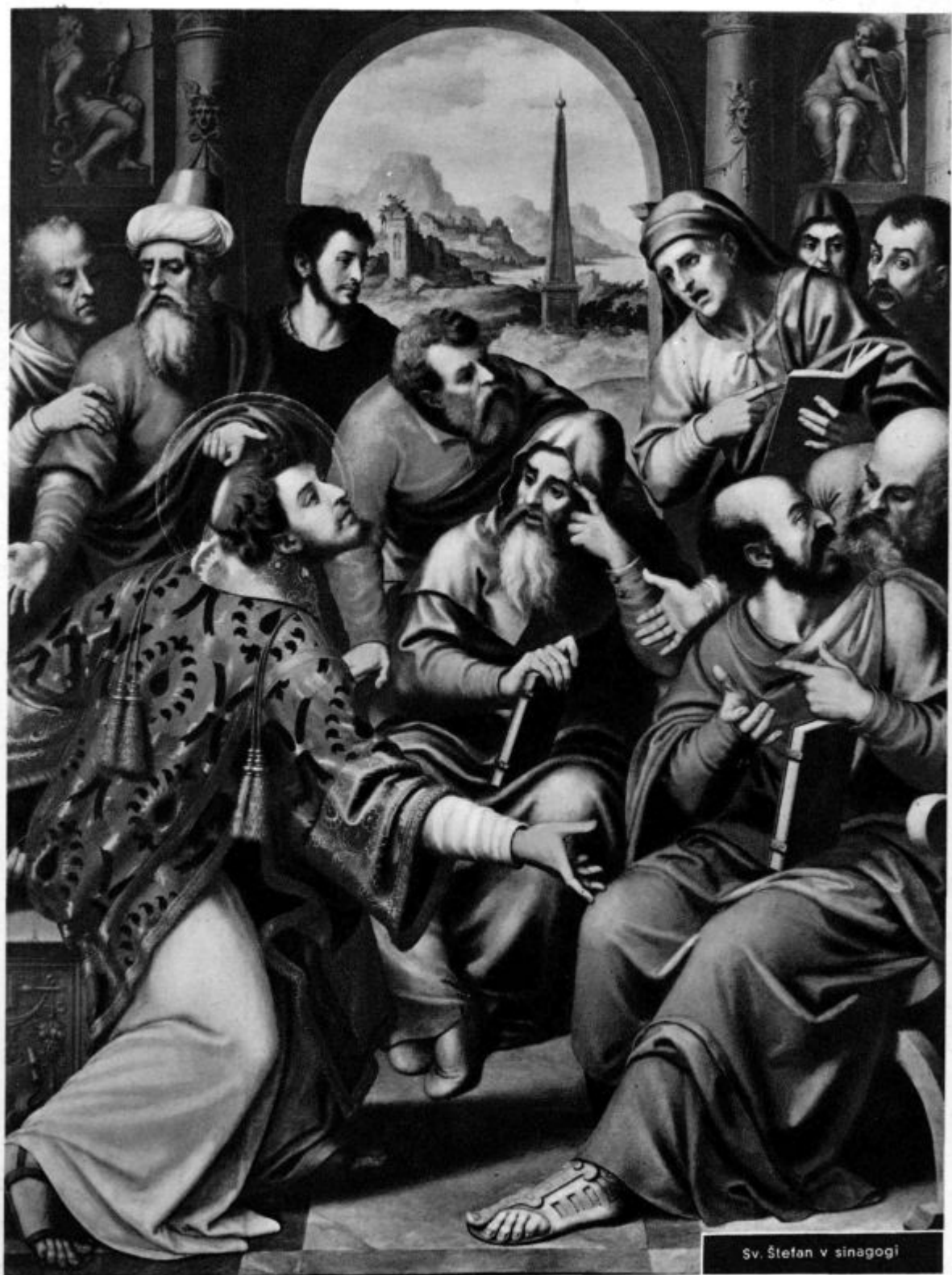
Sv. Štefan v sinagogi