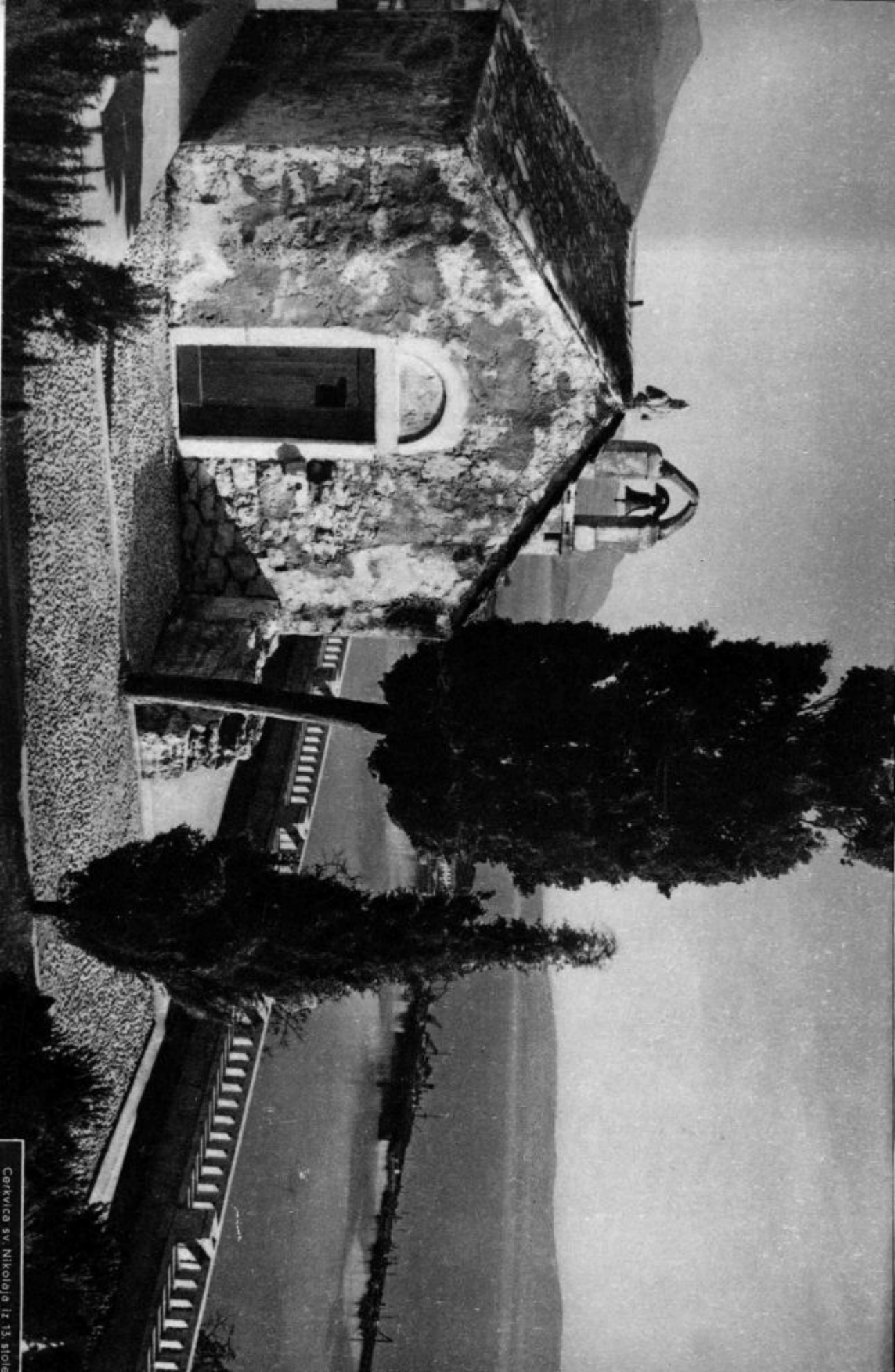
Cerkevica sv. Nikolaja iz 13. stole