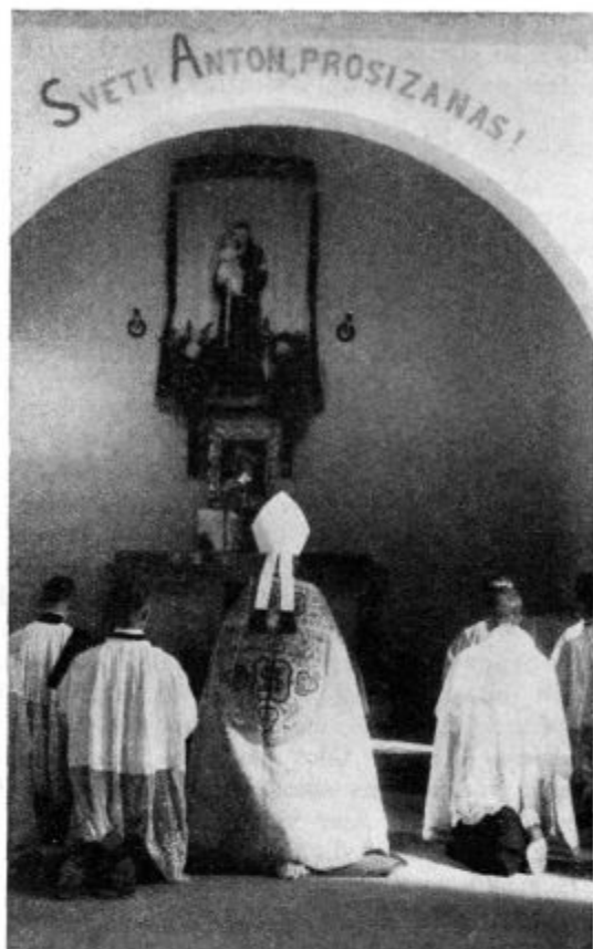
V podružnici sv. Antona na Veliki Loki pri Višnji gori.

Ne bo lahko prebuditi vest iz takega materialističnega mišljenja. V samih krivicah in nasilju, v brezsrčnosti in brezobzirnem boju vest delavcu polagoma otopi, da več ne loči dobrega od slabega, resničnega od zmotnega,