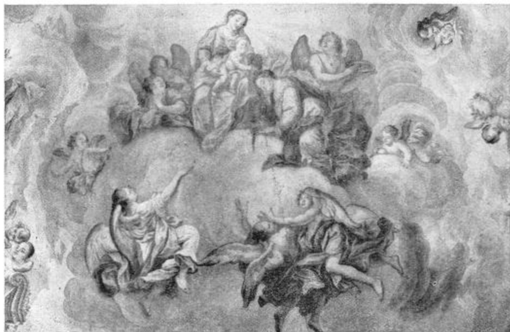
Skaručina: Skrivnostna zaroka sv. Lucije. (Glavna freska v ladji.) (Glej: K našim slikam str. 378.)

Bog namreč nikakor ne podeljuje otrokom življenja samo zato, da bi število ljudi raslo in da bi napolnili zemljo. Vsak otrok, ki se rodi, prejme od Boga življenje, da Boga spoznava, ga slavi, da mu služi in tako enkrat doseže, da ga v nebesih more gledati iz obličja v obličje. Dá, v nebeškem kraljestvu bo Bog sam neizmerno bogato plačilo vsem svojim vernim. In to plačilo je tako veliko, tako lepo, tako sladko in obilno, da ga nobeno človeško uho ne oko ne more zapopasti, a tudi um katerega koli človeka ne. Kako velika sreča, kolik blagoslov božji je torej otrok, rojen za ta vzvišeni cilj!