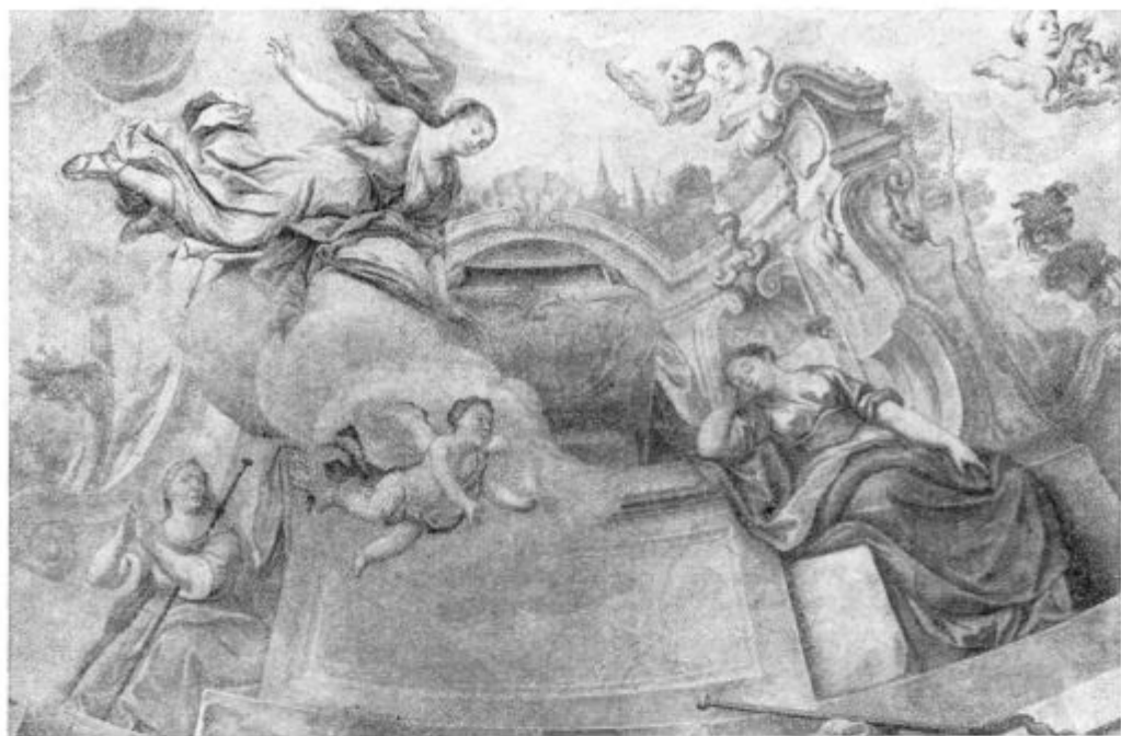
Skaručina: Sv. Lucija in mati spita na grobu sv. Agate. (Glej: K našim slikam str. 378.)

žin. Velika večina celó, čeprav je število velikih družin danes tako majhno in se dnevno krči. Zato pa tudi pada število sv. poklicev. — Če pa Kralj nebes in zemlje izbere tvojega sina ali tvojo hčer, mogoče celo več od njih za svojo posebno službo, potem se krščanski oče, krščanska mati veselita, kajti dala sta kraljestvu božjemu oficirja ali ministra, in upati smeta, da bodo njegove zasluge tudi vajine zasluge, njegova krona tudi vajina krona.