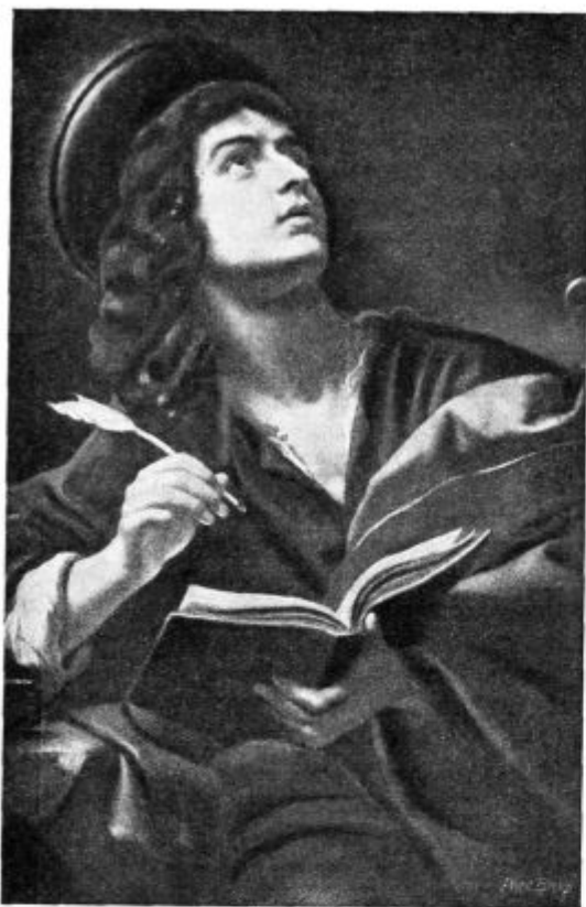
Sveti Janez Evangelist. (Glej: K našim slikam str. 388.)

stranko razpustili in prepovedali vsako delovanje. Oni pa kljub temu niso odnehali in so svoje delo bolj skrili in ga opravljali na tihem, največ med tovarniškimi delavstvom.