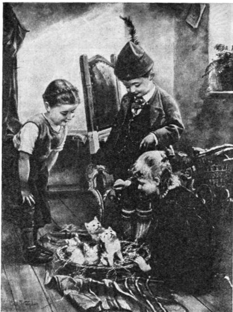
Dveh vrst »mucki«.

Ustanovili smo tudi Elizabetno konferenco, ki je 10. novembra pričela delovati. Radi bi pomagali revežem po domači župniji. Pri-