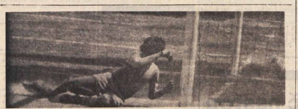
Vratar naraščajnikov Gaje je kar štirikrat pobral žogo iz svoje mreže

Inter SS - Muggesana, Audax - Juventus, Duino - Stock, Edera - Campanelle, Primorje - Libertas, Breg - Fossalon, Flaminio - S. Anna, Vesna - Zarja.