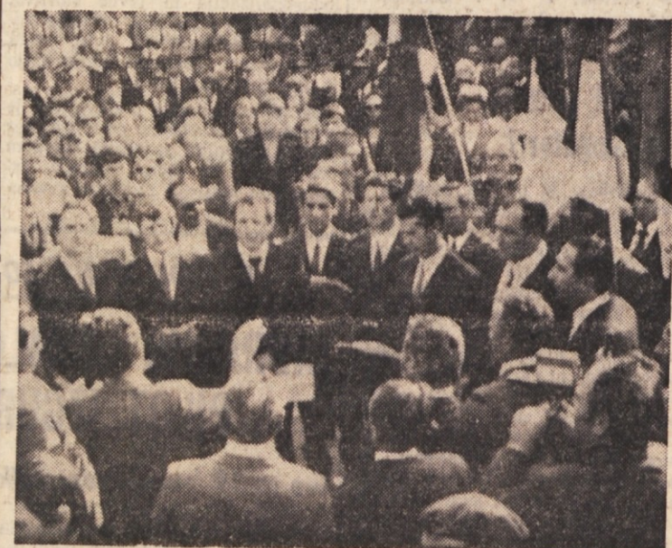
Na sobotnem svečanem odkritju spomenika padlim na Vrh sta nastopila, poleg Partizanskega zbora, še domači pevski zbor, ki ga vidimo v ospredju ter številni člani «O. Dupačiča». Domači solarji pa se polagali šopke cvetja