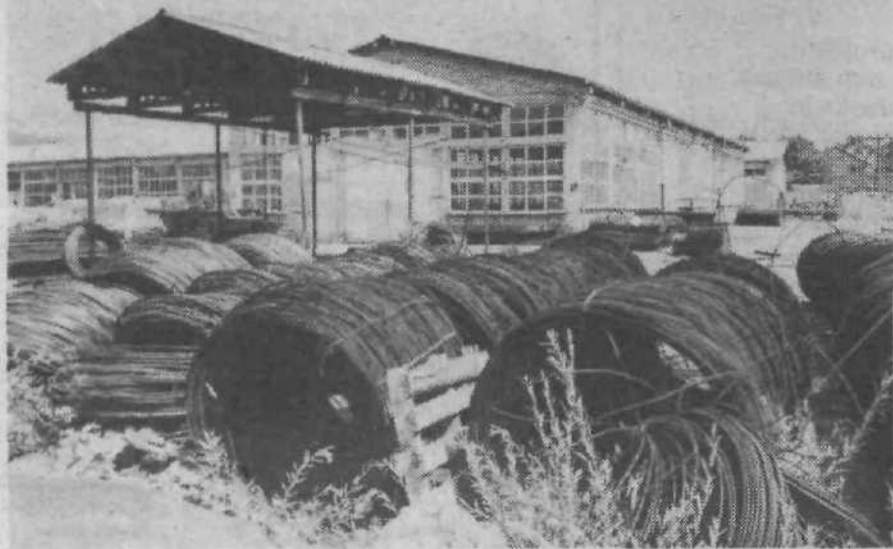
Obširna in najmodernejša železokrivnica »predela« na stotine ton gradbene žice letno.

Vse to pa ne bi bilo mogo- če, če v GP Bežigrad ne bi bilo izredno marljivega dela družbenopolitičnih organi- zacij. Zlasti partija, mladina in sindikat so nosilci takšne družbene in poslovne narav- nanosti, po kateri je možen samo napredek, zdravi in to- variško topli medsebojni od- nosi, ter jasen pogled v pri- hodnost. Naslednje leto bo- do praznovali trideset let ob- stoja, trideset let dela in ustvarjanja.