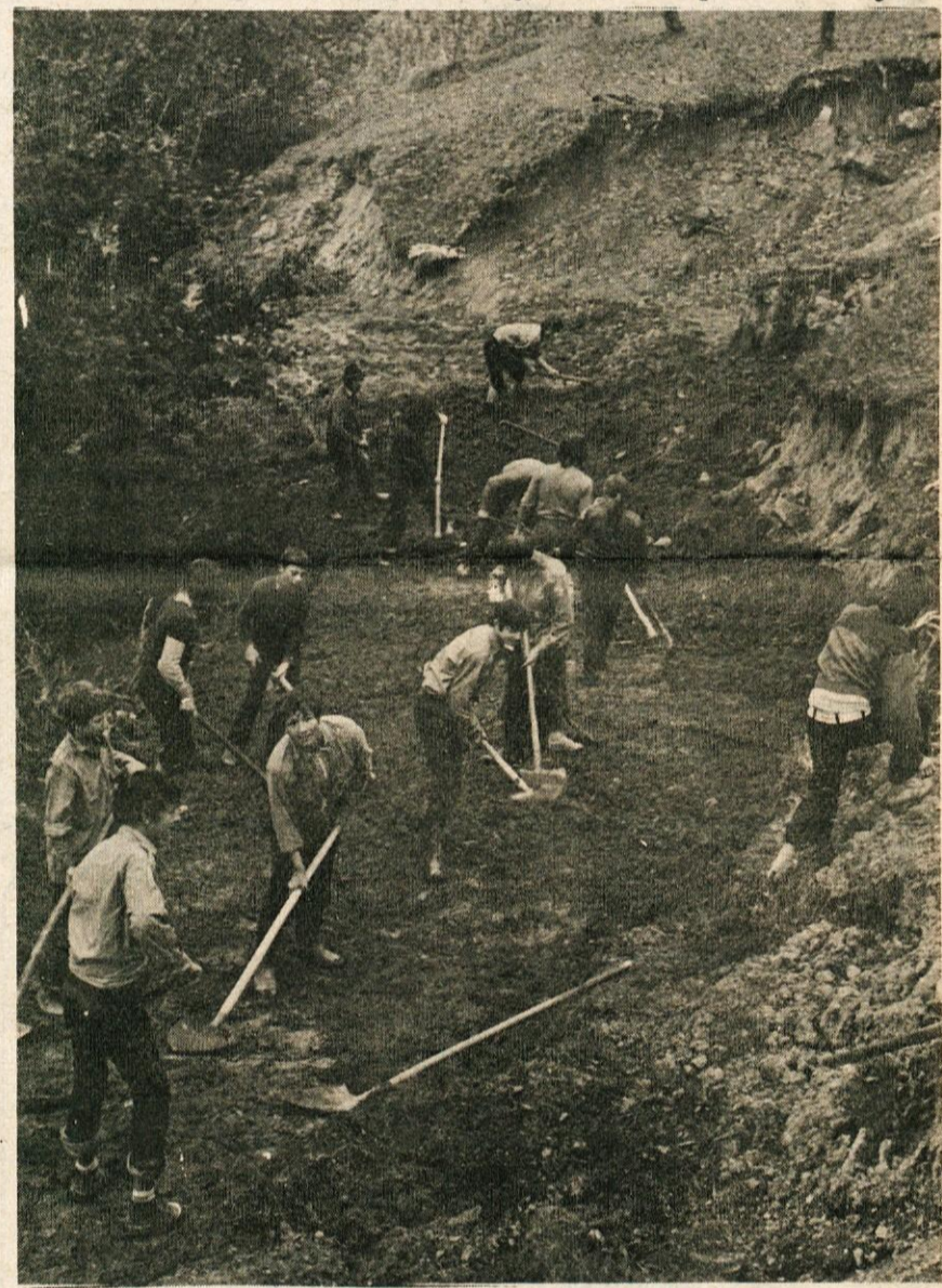
Mladinske delovne akcije so vedno bolj množične. Posnetek je iz delovne akcije litijske mladine v KS Dole, ki je pred leti tu urejala cesto

Prostovoljno delo sicer poznajo po svetu, vendar so delovne akcije naša, jugoslovanska, posebnost. Delovna angažiranost mladih med NOB, povojne velike akcije, v katerih je mladina skupaj z ostalimi gradila mnoge osnovne industrijske in infrastrukturne objekte, akcije, v katerih je mladina prekosila samo sebe in dala družbi mnogo več, kot je kdorkoli od nje pričakoval. Vendar se je mlada generacija že takrat zavedala, da gradi sebi, za družbo, katere sestavni in enakopravni del je, za družbo, v kateri bo živela, delala, se učila, za družbo, za Titovo, socialistično samoupravno Jugoslavijo, v kateri človek, tudi mlad, s svojo ustvarjalnostjo prispeva za svoj in družbeni napredek in razvoj.