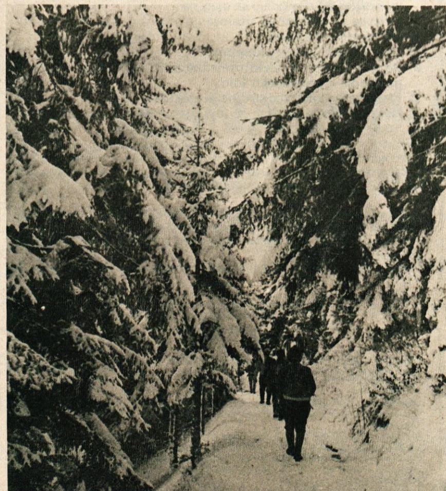
Na poti s Šmohorja na Kal nas je dva dni pred pričetkom pomladi spremljal tudi sneg