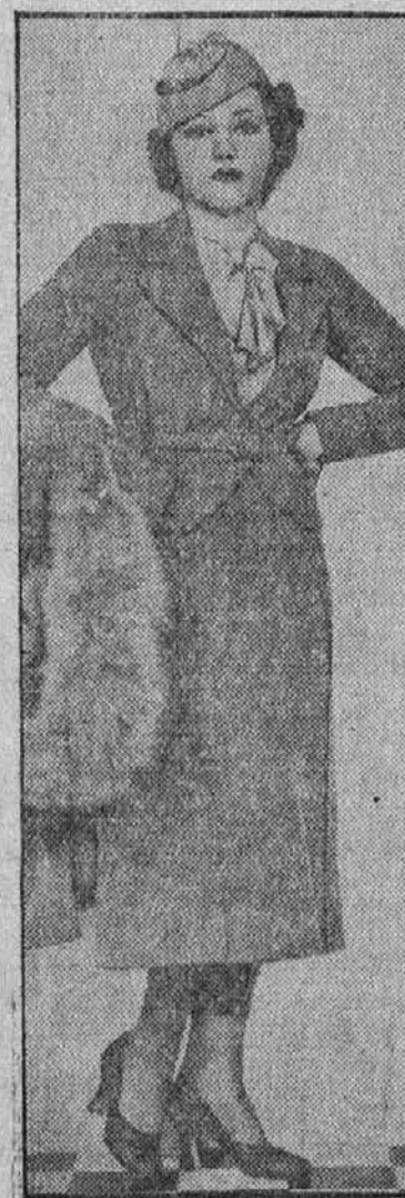
Constance Cummings, filmska igralka, v lepi jeanski modi.

6905-07 Superior Ave. 404 E. 156th St. 6022 Broadway