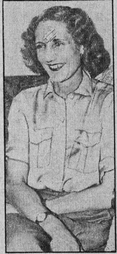
Mrs. Beryl Markham, angleška aviatarka, ki je prva ženska, ki je preletela Atlantski ocean v zapadni smeri.

Komaj je izgovoril te besede, je zagrmelo v tretje, nad glavnimi jim je pričelo pokati in v naslednjem trenutku se je zrušil njihov veliki jambor z glasnim truščem na krov. Kakor se je zdelo, se je bitka pričela. — Kapitanu Leighu pa se ni še nikamor mudilo.