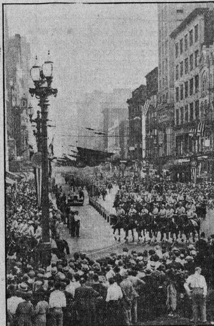
Pogled na parado ameriških legionarjev v Clevelandu, ko so imeli tukaj konvencijo.

ljala sem in tja nad glavo svojega gospodarja.