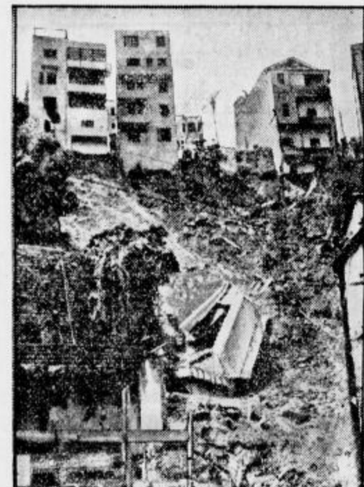
Med silnimi viharji se je v Rio de Janeiro podrl cel sklop velikih hiš. Bilo je mrtvih 20 ljudi. Pogled na glavni kraj nesreče, kjer je voda hišam izpodjedla temelje.