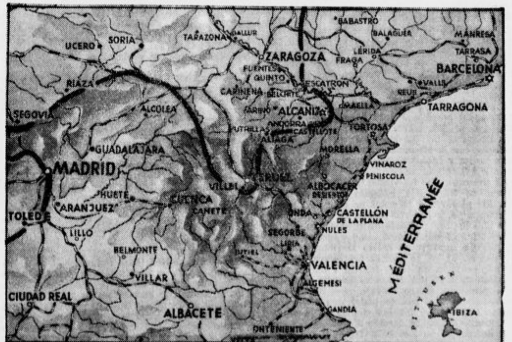
Položaj na Španskem. Debela črta kaže sedanjo fronto na bojišču, kjer bele le še ozek pas loči od morja. Če beli pridejo do morja, bo pretrgana zveza med Valencijo in Katalonijo.