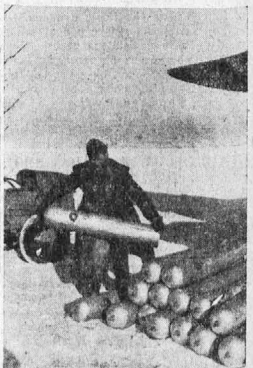
Na letališču v Albaniji nalagajo na letalo bombe