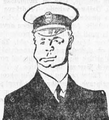
A. V. ALEXANDER

LONDON, 19. febr. Reuter. Prvi lord admiraltete Alexander je sinoči v govoru po radiu dejal, da je njegova glavna skrb, da »britska flota, to »srce vse naše borbe« ohrani prometne zveze