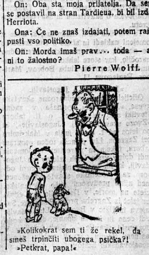
»Kolikokrat sem ti že rekel, da ne smeš trpinčiti ubogega psička?! »Petkrat, papa!«

Ona: Ali si siromak! On: Oba sta moja prijatelja. Da sem se postavil na stran Tardieua, bi bil izdal Herriota. Ona: Če ne znaš izdajati, potem rajši pusti vso politiko. On: Morda imaš prav... toda — ali ni to žalostno? Pierre Wolff.