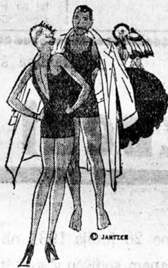
KABINA ZA POSKUŠNJO!