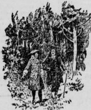
Sprehajal sem se s francoskim duhovnikom.

Nekaj dni po slovesni pojedini sem se sprehajal s francoskim duhovnikom v bližini obale. Večkrat sva se tako sprehajala in pogovarjala, kajti bil je najbolj izobražen človek na otoku in lahko sem se pogovarjal z njim tudi o čem drugem, ne o jedi in pijači. Saj človek ne živi samo od kruha, ampak mora hraniti tudi dušo. Zato mi je bila duhovnikova družba prijetna, koristna in lahko rečem tudi potrebna. Zdi se mi, da tudi njemu moja družba ni bila neprijetna.