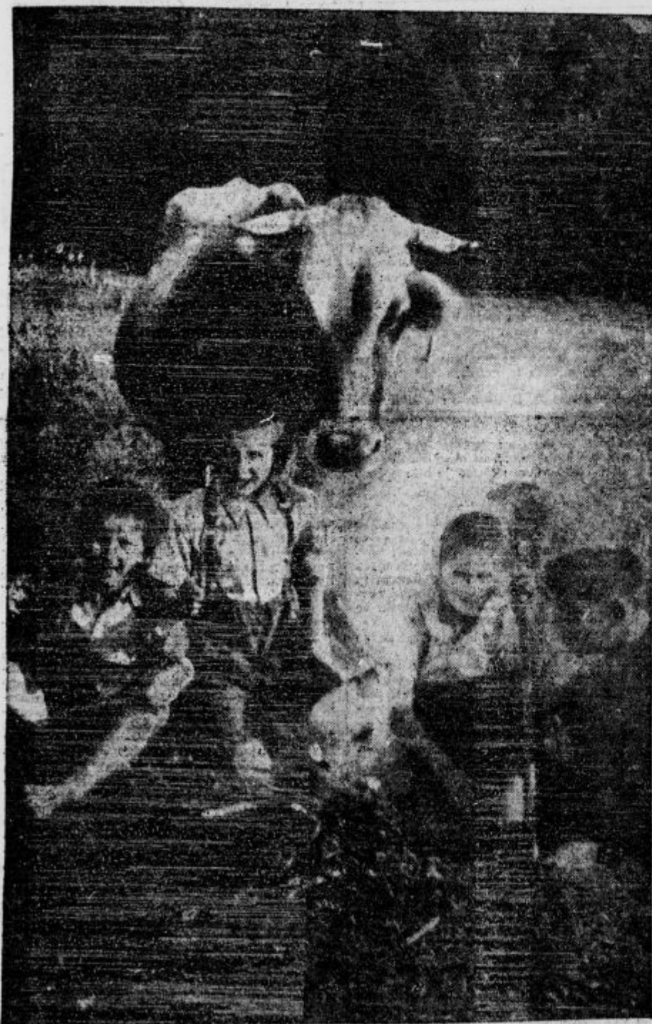
Na paši so zakurili — imalu bo pečen krompir

Toda uradni komunistični dokumenti, nečloveško mučenih mrtvakov polne krimsko, kraško in druge jame, zapisniki in načrti po 30 tisoč obsojenih žrtev v Ljubljani in podobni želju, pogorišča in grobišča, ki so značilni spomeniki le v tistih krajih, kjer je kdaj gospodovala Osvobodilna fronta, in nerazumljivi pobegi deset in deset tisočev beguncev iz »komunističnega osvobojenega ozemlja« v slovenske »neosvobojeno« ozemlje so zgovorne priče, kako boljševiška Osvobodilna fronta namerno uničuje narodovo premoženje in življenje, ne da bi narodu pomagala, ampak da bi narodu naložila komunistični jarem, ki je izmed vseh jarmov najbolj strašan.