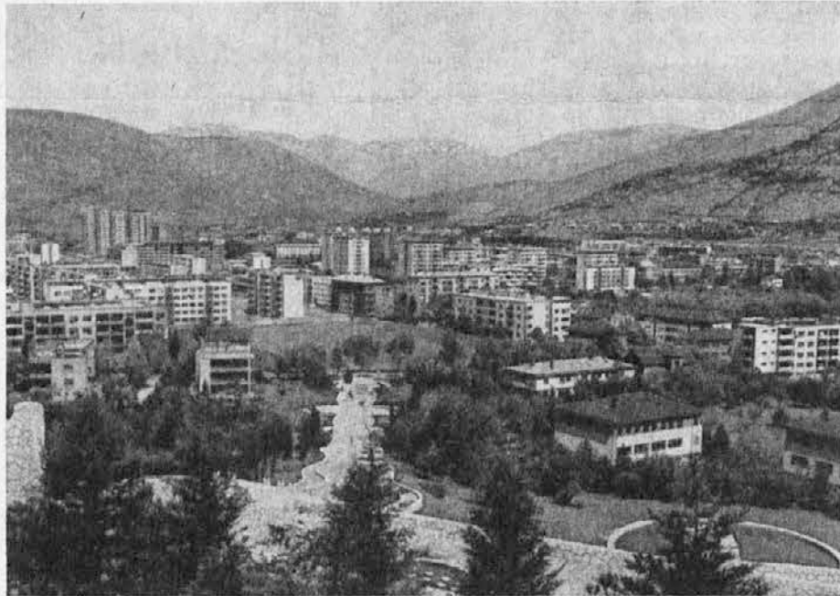
Novi del glavnega mesta Hercegovine Mostarja. Stari del pa se ponaša s slikovitim mostom, ki se drzno pne v enem samem loku preko zelene Neretve