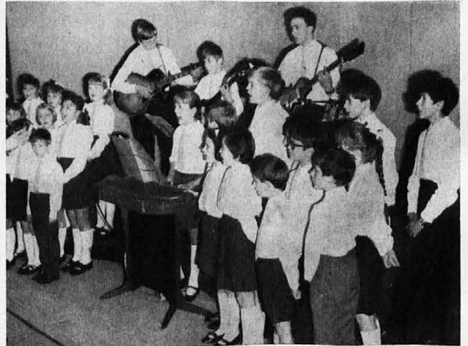
Mladinski zbor »Slomšek« iz Bazovice. Nastal je pred nekaj več kot enim letom v okviru Glasbene šole v Slomškovem domu v Bazovici. Nastopil je že večkrat z uspehom. Zbor je preteklo nedeljo nastopil na misijonski nedelji v Doberdobi, videli ga pa bomo tudi na odru Katoliškega doma v Gorici v nedeljo, dne 8. novembra

Objavljamo slike zborov, ki so nastopili na lanski reviji in vas vabimo na letošnjo