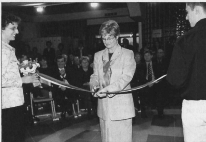
Otvoritev višje šole v Brežicah leta 2000

Med pomembnejšimi prednostmi šole so tudi zelo dobri delovni pogoji, tako glede dveh sodobno opremljenih velikih predavalnic, dveh računalniških laboratorijev, kakor tudi