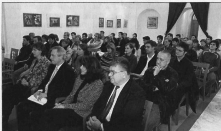
Podelitev letošnjih štipendij

V praksi to pomeni, da se podjetjem, ki se javijo na javni poziv in so izbrana, omogoči vključitev v sistem subvencioniranega kadrovskega štipendiranja. Podjetje zagotovi tretjino sredstev za štipendijo, tretjino sredstev zagotovi občina v kateri ima podjetje sedež, preostalo tretjino sredstev pa zagotavlja Regionalna razvojna agencija Posavje iz naslova neposrednih regionalnih spodbud.