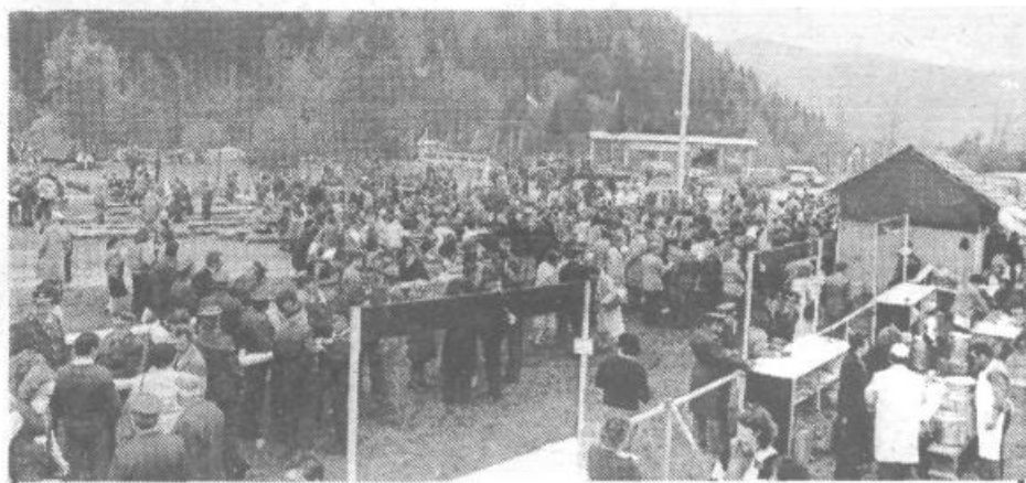
Praznovanja ni motilo tudi nekoliko hladnejše vreme, saj so gostitelji poskrbeli domala za popolno gostoljubje številnih udeležencev