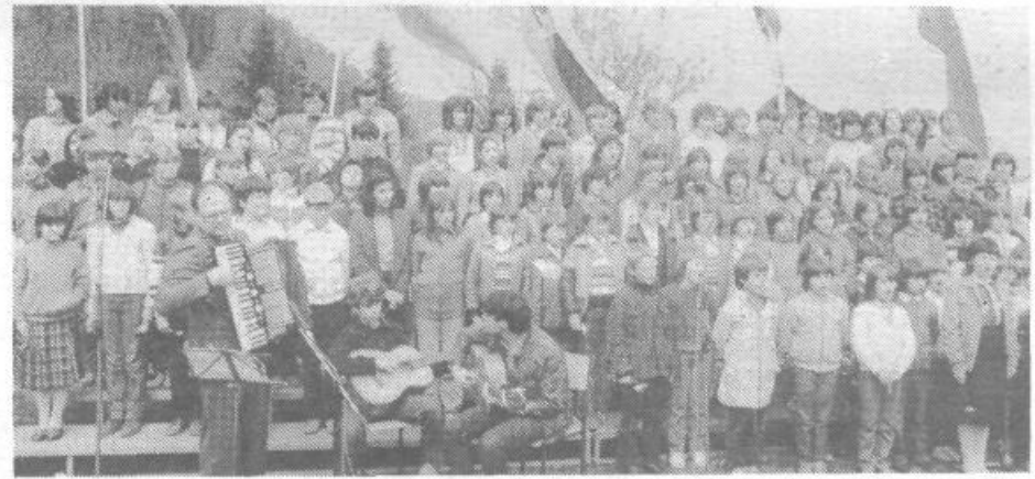
Pesem mladosti, svobode in vznesenosti prežeta z revolucionarnim izročilom je bila ob spremeljavi viške godbe na pihala in v izvedbi šolskih zborov iz OŠ Ljubo Šercer Ig in Oskar Kovačič izpeta udeležencem in prazniku v pozdrav.