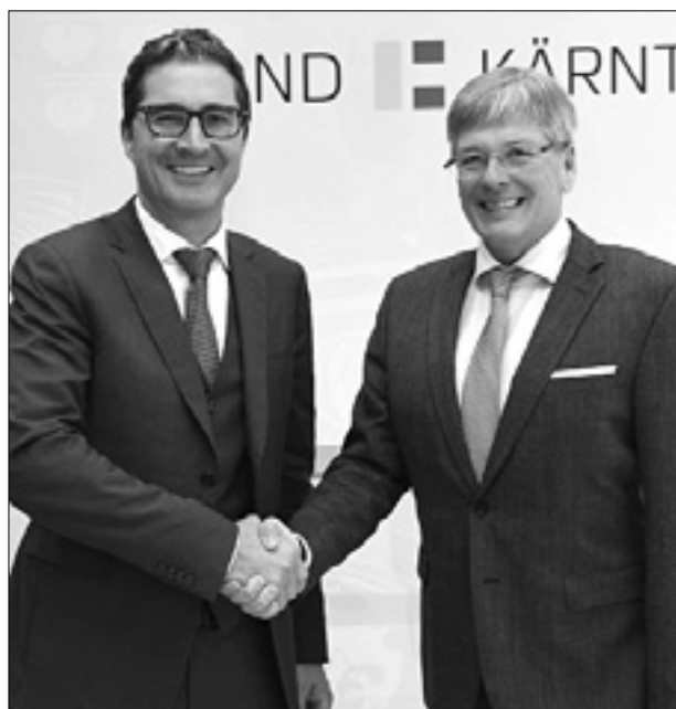
Prvič sta se včeraj v Celovcu srečala deželni glavar Koroške Peter Kaiser (desno) in južnotirolski predsednik Arno Kompatscher (levo)