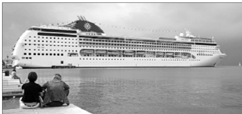
Ladja Msc Opera v Trstu leta 2007