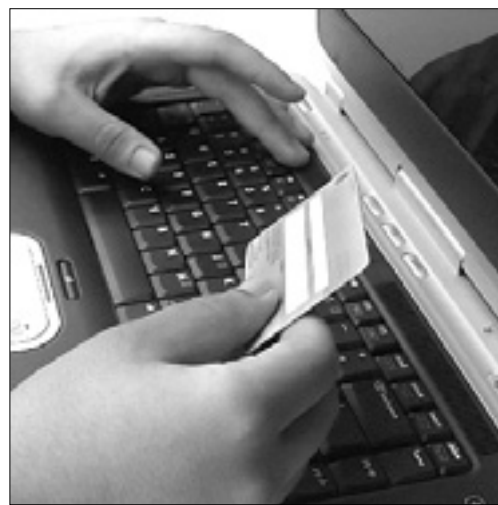
Spletnih goljufov je vse več

V zadnjih časih so spletne goljufige vse bolj razširjene, med žrtvami so seveda tudi prebivalci iz najrazličnejših krajev goriške pokrajine. Tipična »phishing« prevara se prične z elektronskim sporočilom, ki naj bi ga nam poslala banka ali ponudnik neke spletne storitve. Obvestijo nas, da se moramo zaradi preverjanja podatkov ali dodatnih ugodnosti prijavit in ponovno vnesti svoje podatke. V sporočilu se nahaja tudi povezava, na katero naj bi kliknili, vendar nas vodi na lažno spletno stran, ki je zelo podobna, morda skoraj enaka strani legitimnega ponudnika, kar nas lahko zavede. Če na tej lažni, »phishing« strani vpišemo geslo za dostop in druge osebne podatke (npr. podatke o kreditni kartici), smo jih pravzaprav posredovali goljufov, ki običajno zatem malce počakajo, preden poberejo denar s kreditnih kartic ali bančnih računov svojih žrtev. Tako jih je veliko težje izslediti. Oškodovanci se po nekaj mesecih včasih niti ne spomnijo, ob kateri priložnosti so v splet vpišali svoje osebne podatke. Dodatno težavo predstavlja dejstvo, da spletni goljufi pošiljajo svoja sporočila iz azijskih ali afriških držav; odkrivanje njihove identitete je zato izredno zapleteno, saj je potrebna mednarodna tirailica. Ronški sedemdesetletnik je tako konec koncev imel »srečo«; ogoljufati sta ga skušala Turinčana, ki so ju policisti uspeli izslediti in prijavit.