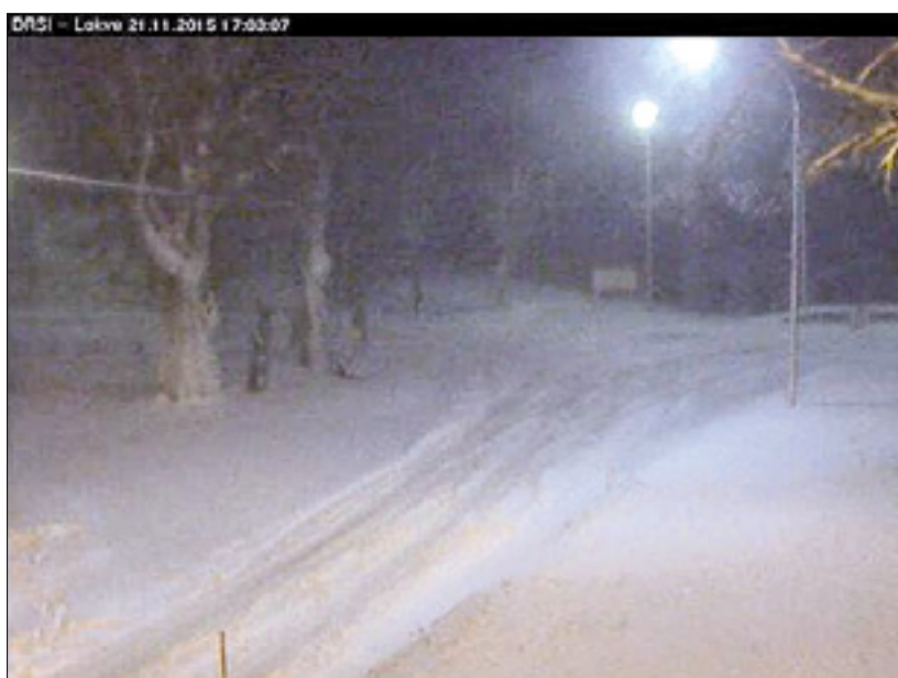
Nočna snežna idila na Lokvah

Prvi sneg je včeraj pobelil Lokve, kjer ga je za sankanje že čisto dovolj. Snežiti je začelo v dopoldanskih urah, do večera je na Trnovski planoti padlo od petnajst do dvajset centimetrov snega, na Idriskem, Cerkljanskem in na Vojskem tudi do štirideset centimetrov. Zaradi sneženja so včeraj popoldne na cesti Ajdovščina - Col - Črni Vrh - Godovič prepovedali promet za priklopnike in polpriklopnike. Med Ajdovščino in Razdrtim je težave povzročala burja; med priklučkom Selo in cestninsko postajo Nanos je bil zaradi močnih sunkov prepovedan promet za vsa vozila s ponjavami in hladilnike.