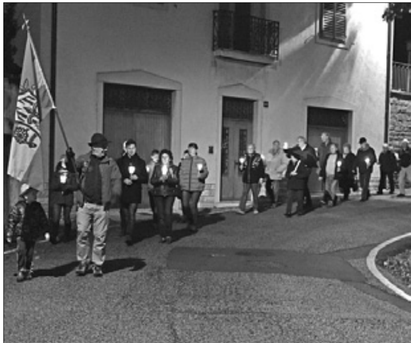
Utrinka s petkove spominske slovesnosti v Dolini