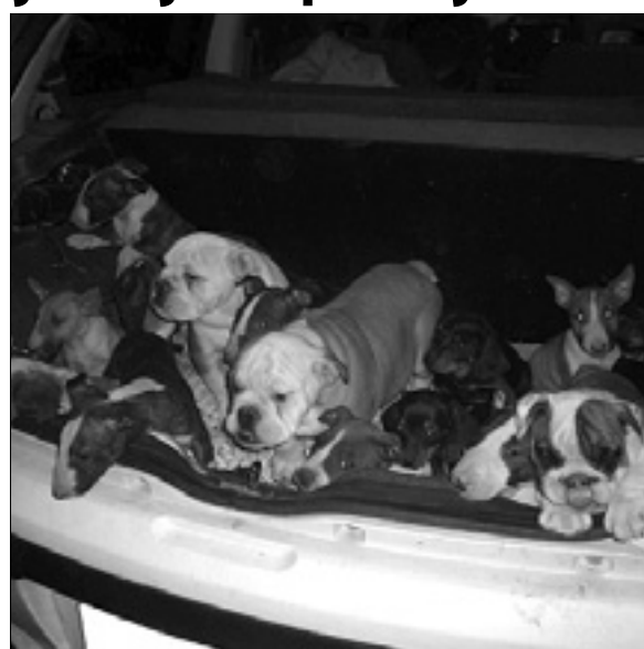
Psički so bili zaprti v prtijažniku brez hrane in vode

Goriški finančni stražniki so vozniaka in potnika avtomobila kazensko ovadili zaradi mučenja živali; eden izmed njiju je bil v preteklosti že obravnavan zaradi podobnega dogodka. Pasje mladičke so odpeljali v zavetišče za male živali; kdor bi jih rad posvojil, naj do 26. novembra piše na naslov elektronske pošte go103.protocollo@gdf.it. V sporočilu naj napiše svojo telefonsko številko in naj pojasni, katere pasme si najbolj želi. Moška sta psičke kupila za nekaj deset evrov; z njihovo prodajo bi v Italiji zaslužila kakih deset tisoč evrov.