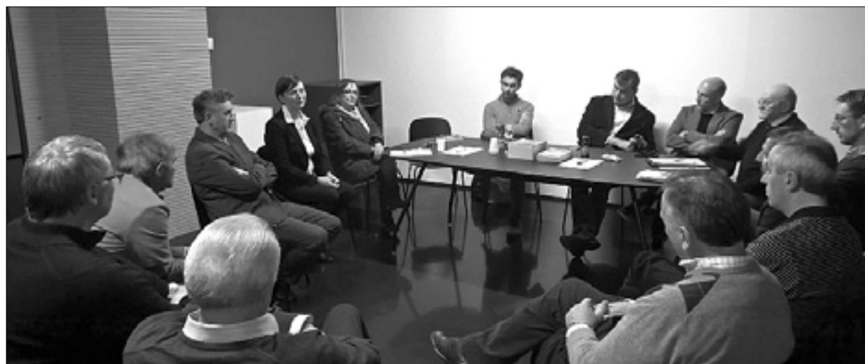
S petkovskega pogovora z videmskimi pokrajinskimi svetniki v prostorih multimedijskega muzeja SMO v Špetru