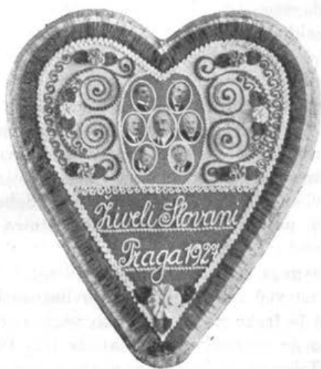
Darilo češkoslovaških čebelarjev slovenskim čebelarjem. Srce je visoko 60 cm.

Pozdravljena zlata Praga! Zdravstvijte, češkoslovaški čebelarji!