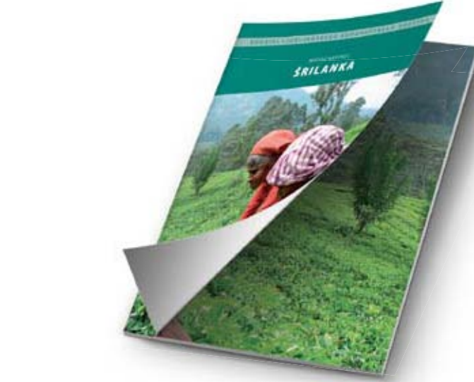
Slika 2: Naslovnica vodnika po Šrilanki (Napokoj 2011).

Vodniki so sprva izhajali izključno v okviru Ljubljanskega geografskega društva. Prvih nekaj jih je nastalo v