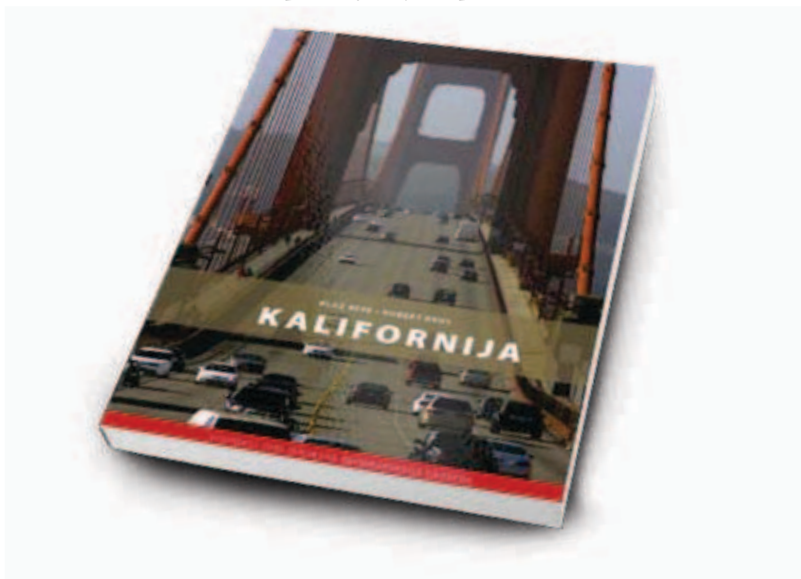
Slika 1: Naslovnica vodnika po Kaliforniji (Repe in Brus 2012).

Vodniki so razdeljeni v več zbirk, ki so urejene po celinah (doslej so izšli vodniki po evropskih, severnoameriških, afriških in azijskih državah). Predvsem po zasnovi jih lahko razvrstimo v dva tipa. Prvega sestavljajo vodniki, v katerih je zbranih po nekaj enodnevni ekskurzij v Sloveniji ali bližnji okolici, predvsem na Hrvaškem ter v Italiji, drugega pa vodniki, v katerih je samostojno in zato zelo poglobljeno predstavljena večdnevna ekskurzija v tujino – navadno gre za enotedenske ali celo daljše ekskurzije v bolj oddaljene evropske in tudi druge države. Vodniki z več ekskurzijami so plod dela več avtorjev, vodniki v tuje države pa (predvsem v zadnjih nekaj letih) navadno le enega ali dveh. Izpostaviti je treba, da poleg avtorjev pri izdaji vodnika sodelujejo še uredniki, recenzenti, kartografi in fotografi, kar pomeni, da so vodniki LGD v vseh pogledih ustrezno recenzirani in urejeni.