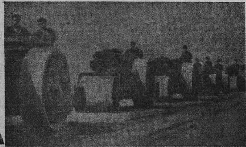
Veljkanski parni valjarji, ki jih uporabljajo v sovjetskii Rusiji pri gradnji modernih cest v drugi petletki.