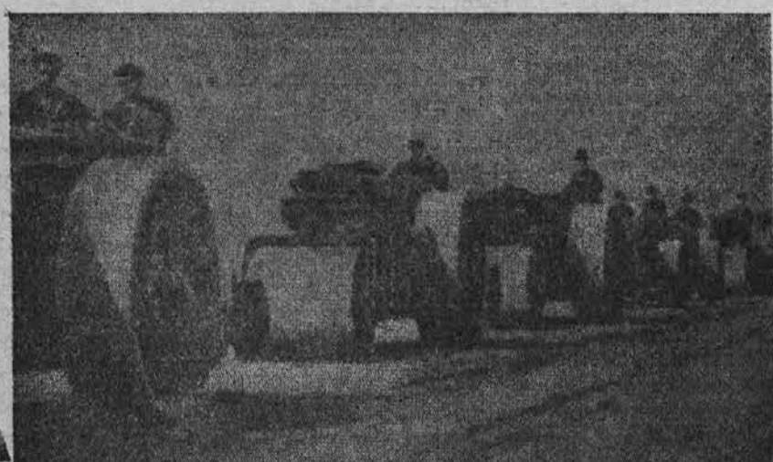
Velikanski parni valjarji, ki jih uporabljajo v sovjetskii Rusiji pri gradnji modernih cest v drugi petletki.