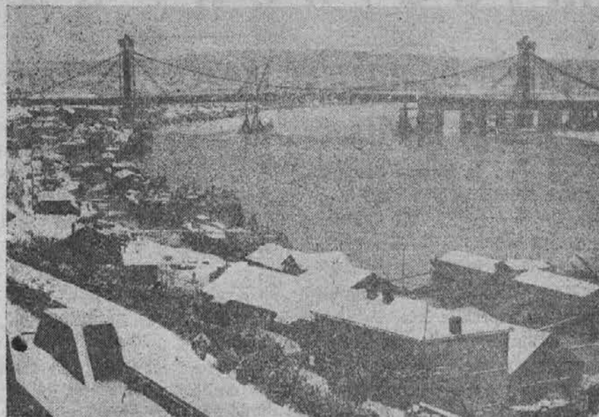
Pogled na novi most, ki veže Beograd z Zemunom. Novi savski most spada med najboljše dela moderne tehnike. Z gradnjo se je bilo pričelo leta 1930 in je letos končalo. Beograd in Zemun bosta preko mosta zvezana z železniško cesto, tako, da bosta lahko obe mesti enotno trgovali. Na obeh straneh mosta bodo postavljeni umetni kipi, po načrtu prof. Mestroviča.