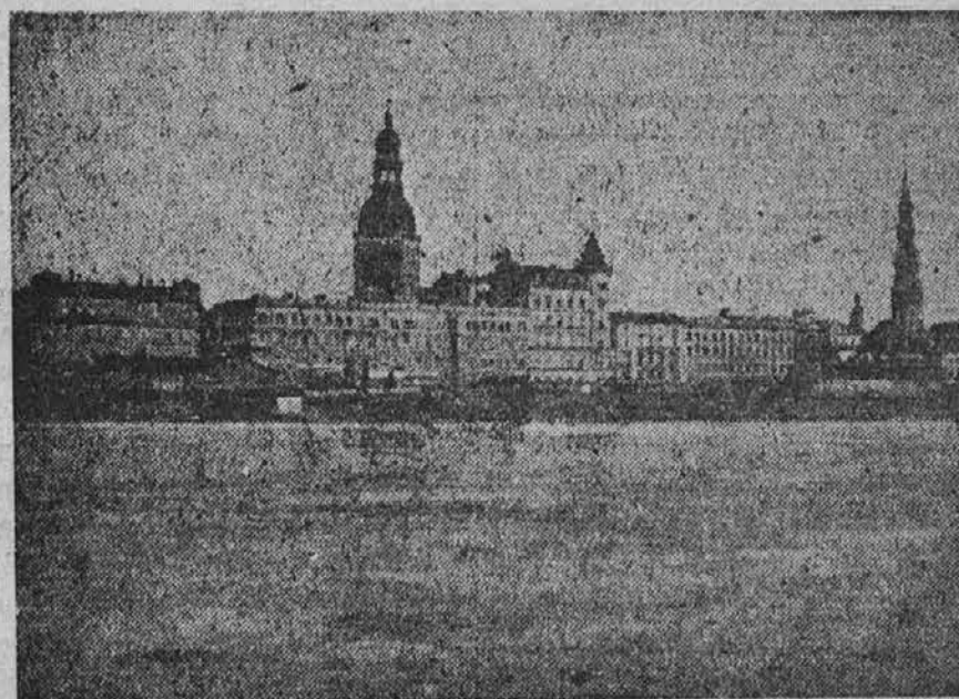
Pogled na Rigo, glavno mesto Letonije. Letonija spada k baltičkim državam in je Slovanskega porekla