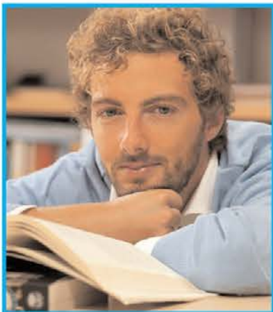
Roman "Stvari, ki jih nihče ne ve" odpira pereča vprašanja in težave, ki tarejo sodobnega zahodnega človeka in mladostnika, a ponudi tudi nekaj predlogov, da bi ta vprašanja rešili.

Pred časom smo o tem romanu že pisali ob predstavitvi prvega romana izpod peresa sicilijanskega profesorja literature in pisatelja, "Bela kot mleko, rdeča kot kri". Nalašč sem zapisal, da je avtor najprej profesor, saj mu to predstavlja prvotno poslanstvo, je pa zagotovo tudi dober, zelo dober pisatelj. Zame je ta drugi roman še veliko boljši od prvega. Med drugim drži, da so korekturo prvega opravili dijaki, ki jim je D'Avenia roman dal najprej v branje, drugega pač ne. Če so odrasli v prvem romanu predstavljeni kot "idealni", pa so v romanu "Stvari, ki jih nihče ne ve" predstavljeni v vsej svoji krhkosti in nemoči. Nekaj zelo dobrodošlega je, da avtor obravnava tiste najbolj pereče težave današnjega časa, kamor pri odraslih najbolj sodi prav to, da kdo od staršev zapusti svojo družino zaradi druge osebe, s katero je začel zvezo - v tem primeru je tisti, ki je zapustil družino, Margherita oče. Kdo pa je ta Margherita? Štiri-