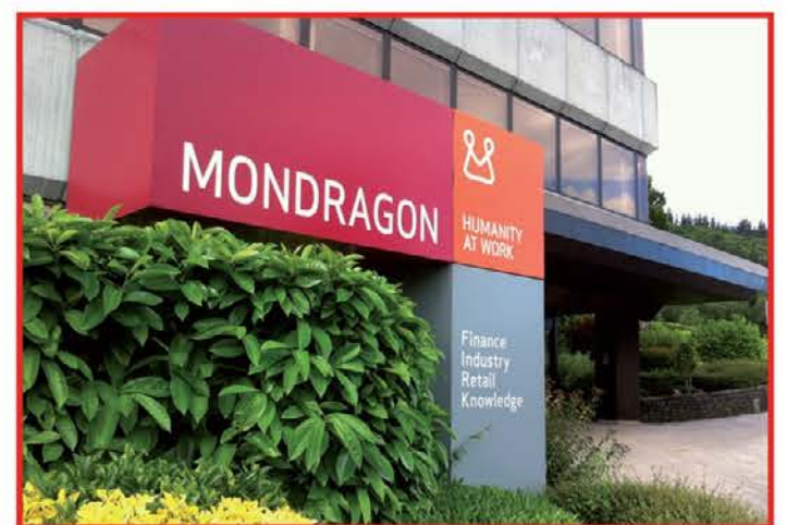
Španska korporacija Mondragon

in bogatimi, socialno izključevanje, neenakopravnost, kršenje človekovih pravic itd. Primer korporacije je lahko vzor krščanskim poslovnem pri oblikovanju krščanskega poslovnega modela. Na Primorskem so številna podjetja propadla ali pa imajo velike finančne težave (Primorje, MIP, Mlinotest, Hranilnica Vipava itd.), kar kaže na napačen ekonomski model. Postavlja se vprašanje, ali se omenjena podjetja lahko združijo v združenje in delujejo po vzoru Mondragona? Ali jim Slovenska zakonodaja to sploh omogoča? Po mnenju raziskovalcev korporacije Mondragon je vseživljenjsko izobraževanje delavcev ključen element njihovega uspeha. Zakaj bi se Slovenska podjetja ne zgledovala po njihovem vzoru? Na spletni strani korporacije Mondragon so še vedno aktualne besede njenega ustanovitelja Arizmendiariete: "Po ničemer se ljudje ne razlikujejo bolj kot po svojem odnosu do okoliščin, v katerih živijo. Tisti, ki se odločijo, da bodo ustvarjali zgodovino in spre-