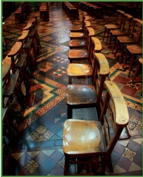
"Niti ne zavedamo se, da nam je nekdo v glavo vcepil prepričanje, da je Bog sovražnik naše svobode."

voljstvo, depresijo, razkole in sovraštva. Kdo nam je to vcepil v naše sive celice? Na to ne znam odgovoriti, lahko pa ga začnemo razkrivati. Vsekakor ne gre za enega pesnika, filozofa ali politika ali zgolj za peščico ljudi. Gre za organiziran sistem, za svetovno moč, ki je že v prejšnjem stoletju poskusila organizirati svet brez Boga. Posledice tega poskusa so bile katastrofalne, če pomislimo samo na Stalina, Hitlerja in Maoa. Brezobziren poskus restrukturacije sveta, ki pa je seveda spretno zavil v celofan demokracije in človekovih pravic, se nadaljuje tudi v 21. st. Tu seveda ne gre za nekaj skeptikov, ki ne verujejo v Boga, za nekaj posameznikov, ki se jim je zameril župnik ali škof, za nekaj posameznikov, ki se jim zdi maša dolgočasna. Resnica je drugačna: tudi če bi bili duhovniki in škofje vsi svetniki in čeprav bi liturgijo izpilili do podrobnosti, bi v srcih ljudi še vedno odmevalo: "Kristus je sovražnik naše svobode! Pogoj za realizacijo človeka je osvoboditev od Boga".