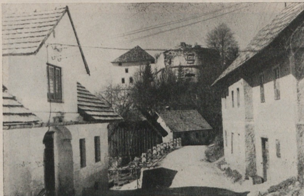
Ze nič kolikokrat smo govorili o Turjaškem gradu. In zdaj prav zares. Ko bodo končana še nekatera restavratorska in obnovitvena dela bo dobil Turjak novo restavracijo med starimi grajskimi zidovi. Otvoritev naj bi bila že prihodnje leto — kdaj, pa je zdaj še težko povedati.

• Kolezija — Zmogljivosti niso polno zasedene, ker vrtec nima prave lokacije, čeprav je iz moralnih in vzgojnih vidikov zelo potreben za okolico v kateri se danes nahaja.