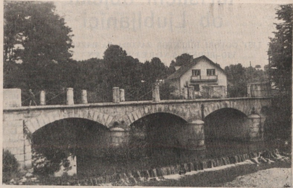
Slednjic se bo izpolnila njihova dolgoletna želja — V Kozarjih bodo gradili nov vodovod — Občinska skupščina je že pred kratkim najela kredit v višini 51 milijonov dinarjev, tako, da bodo lahko s temi sredstvi zgradili vodovod

• Tako ostane naloga stanovanjskemu skladu • naše občine, da ne ostane le pri posvetovanju • njih in sestankih, ampak da se čim prej