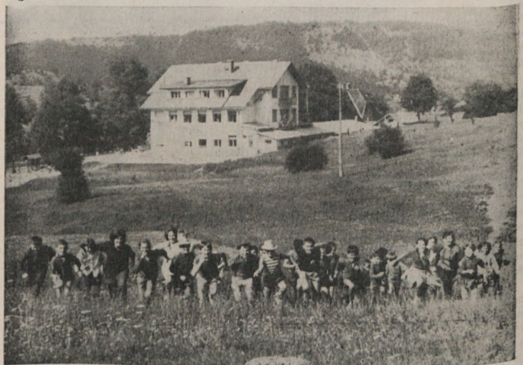
Kot vsako leto je bilo tudi letošnje poletje klimatsko okrevališče na Rakitni polno mladih letoviščarjev — S slike pa vidimo, da prejkone ni manjkalo smeha, veselja in pa zdrave sproščenosti v naravi

Vsi izgledi in razvoj peljejo v to, da ostaneta samo dve relaciji v teh odnosih in sicer: šola; družbeni skladi za šolstvo in šola — prosvetno pedagoška služba. Da pa bo to mogoče doseči, bo morala občinska skupščina prav gotovo bolj izvajati svoje ustanoviteljske dolžnosti zlasti kot koordinarno odnosa do zavoda, ki je z ozirom na veliko materialno heterogenost občin samoustanoviteljic izredno potrebna še zlasti sedaj, ko novi predpisi o verifikaciji in novela zakona o prosvetno pedagoški službi vleče za seboj tudi določene večje materialne zahteve za delovanje tovrstnih zavodov.