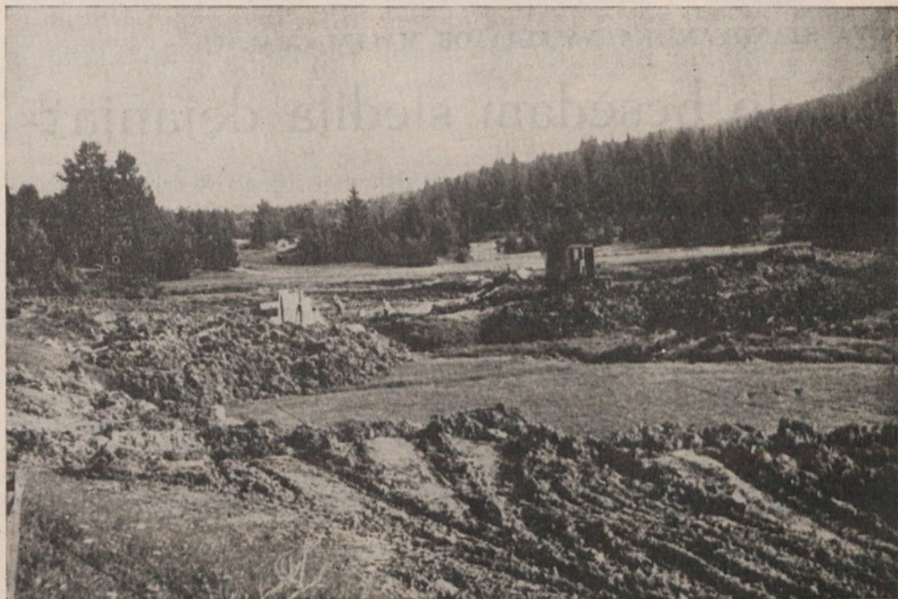
Zemljska dela pri gradnji umetnega jezera na Rakitni gredo v teh dneh že h kraju — že v kratkem bodo začeli z betoniranjem jezerskega dna, tako, da bo novo jezero služilo svojemu namenu že prihodnje poletje

Zgraditev motela in ureditev camping prostora v njegovi neposredni bližini, je zamisel, ki bi jo uresničili do zimske sezone 1966. leta ter bi služil za nastanitev ekip, ki bodo sodelovale na bližnjem svetovnem prvenstvu v hokeju na ledu.