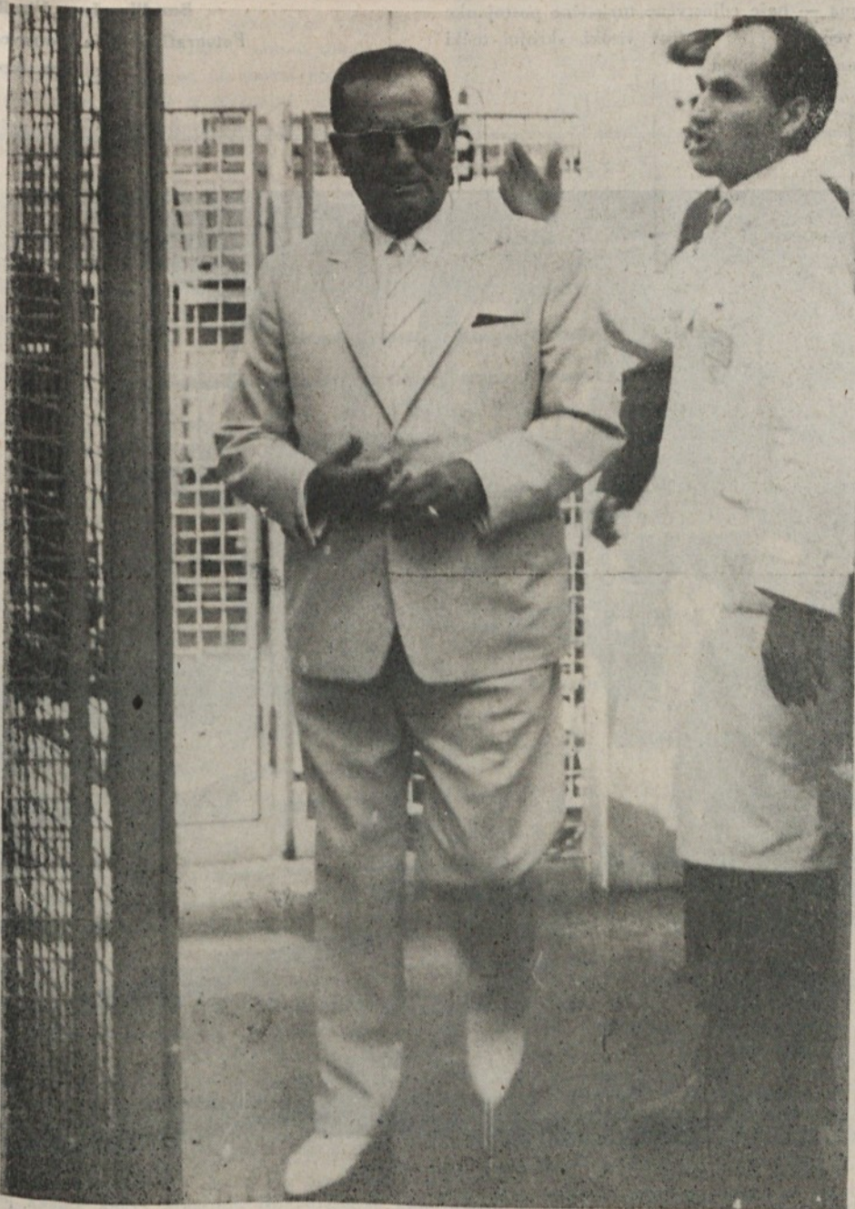
Predsednik Tito se je dalj časa zadržal v vseh laboratorijih in oddelkih inštituta „Jožef Štefan“ — Na sliki ga vidimo v enem izmed oddelkov ljubljanskega nuklearnega inštituta