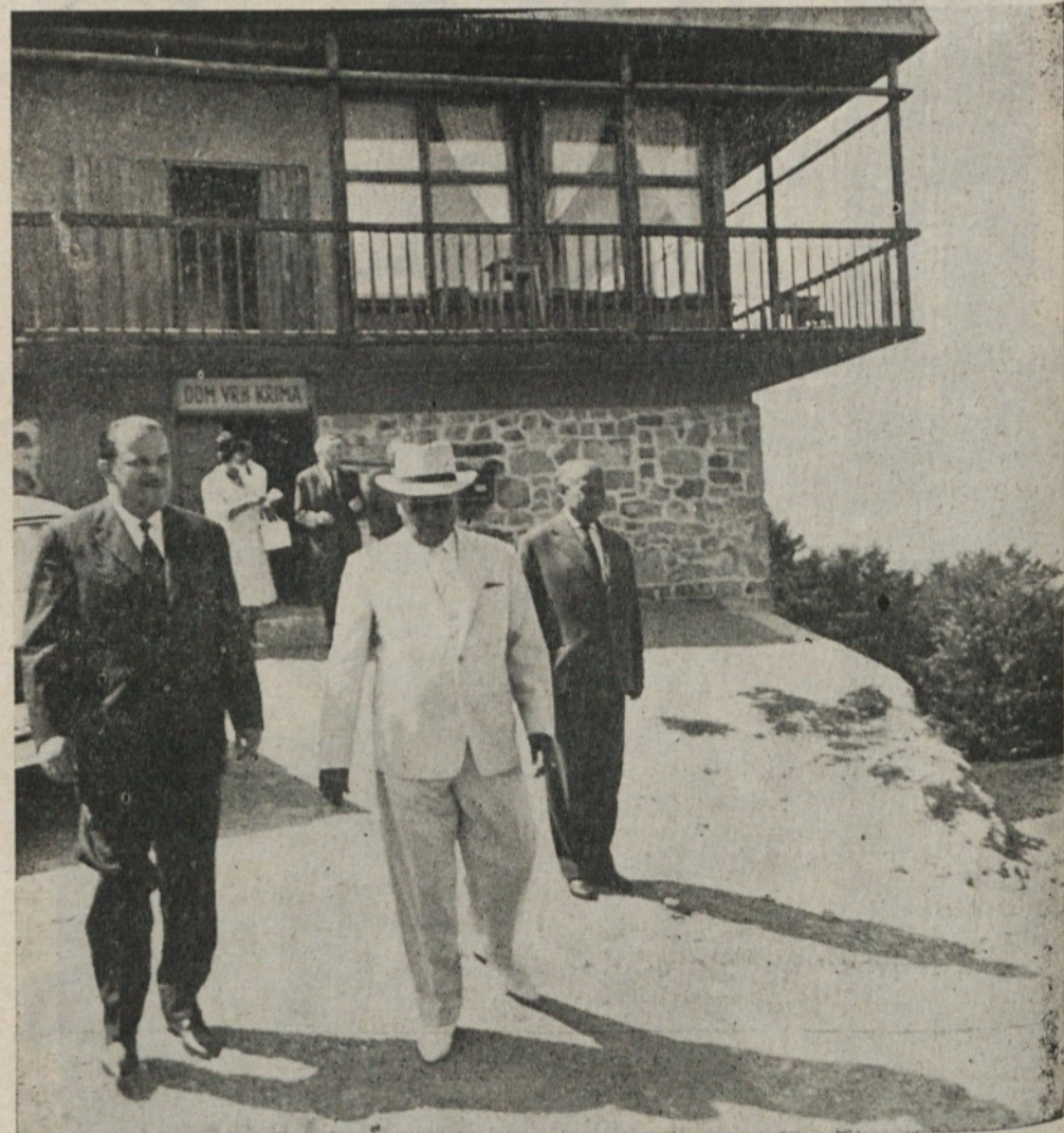
Predsednik Tito odhaja v spremstvu predsednika skupščine SR Slovenije Ivana Mačka po krajšem obisku v turističnem domu na vrhu Krima