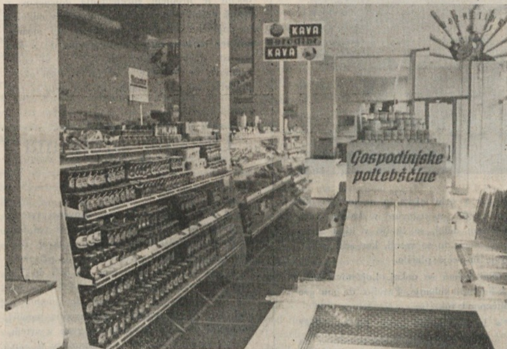
Med številnimi novimi trgovskimi objekti, ki jih je v zadnjem času izročila svojem namenu ljubljanska veletrgovina „Mercator“, je tudi samopostrežna trgovina v Gerbičevi ulici