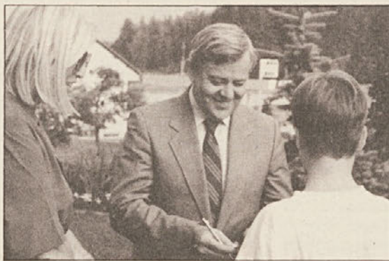
Predsednik avstrijskega parlamenta Heinz Fischer in predsednik Republike Slovenije Milan Kučan pred gostilno Ogris v Bilčovsu.

Državni predsednik Slovenije Milan Kučan je pri tem pogovoru izrazil željo, da bi postala aktivna Mednarodna konferenca za varnost in sodelovanje, v katero naj bi se vključila tudi UNO. Predvsem pa bo potrebno na novo raztolmačiti pozicijo srbske politike in jugoslovanske armade, katera je brezdvomno pospešila agresivno politiko Srbov. Očitek Srbije, da se vmešava mednarodna javnost v notranje zadeve Jugoslavije, je Kučan vehement-