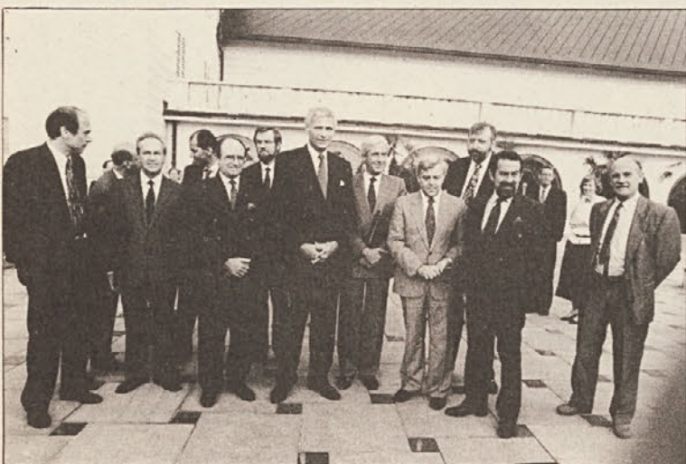
Evropska ministrska trojka na sprejemu pri slovenskem vodstvu prejšnjo soboto na Brdu pri Kranju: drugi z desne je portugalski zunanji minister Jesus de Deus Pinheiro (z brado), na Kučanovi desni sta luksemburški zunanji minister Jacques Poos ter holandski zunanji minister in vodja evropske mirovne trojke Hans van den Broek.

Prejšnji petek je bil v Ljubljani na uradnem in prijateljskem obisku, prvič po vojni, koroški deželni glavar Christoph Zernatto. Že v ranem dopoldnevu ga je sprejel predsednik slovenske vlade Lojze Peterle, nakar so se začeli uradni pogovori obeh delegacij. Pogovor je tekel zlasti o gospodarski pomoči avstrijske Koroške republiki Sloveniji. Eden od ciljev obiska s Koroške pa je bila tudi seznanitev z varnostnimi problemi jedrske elektrarne Krško ter vprašanje datuma zaprtja.