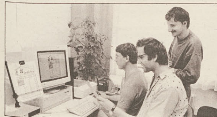
V stavnici delajo danes že z najsodobnejšimi računalniki.