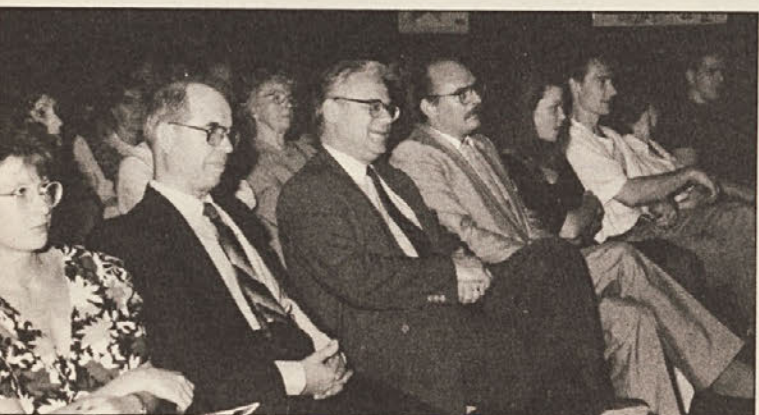
Številni častni gostje so prišli, med njimi tudi vice-kancler dr. Erhard Busek.