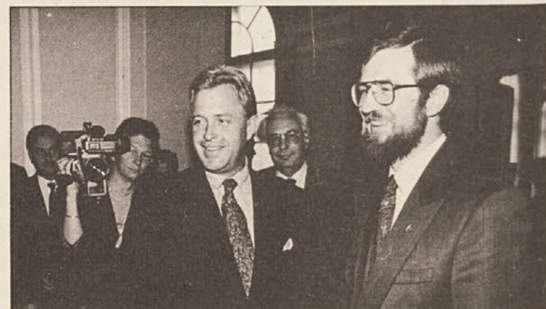
Prvi obisk koroškega deželnega glavarja (levo) dr. Zernatta pri šefu slovenske vlade Lojzetu Peterletu.