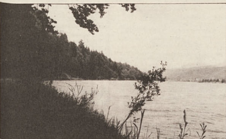
Ekološko pravilno izkoriščanje vodne energije spada med najbolj odgovorne naloge avstrijskih Dravskih elektrarn (ÖDK). Z veliko vneto poskušajo tehniki smotno povezati ekologijo in ekonomijo. Predstavitev delovanja ÖDK si lahko ogledate na eni izmed razstavnih stojnic. (+)

Das und vieles mehr finden Sie in der neuen Gestaltungsbroschüre „Die sb-Grünidee“ von Semmelrock sb. Fordern Sie „Die sb-Grünidee“ an; bei Semmelrock sb, Klagenfurt.