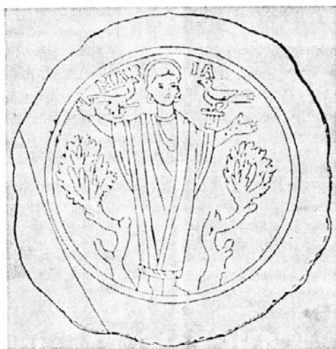
Marija Vnebozeta v katakombah