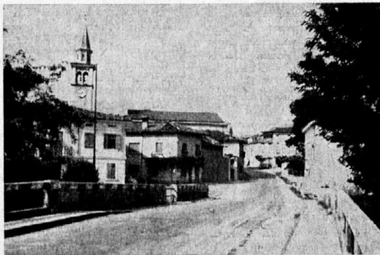
MIREN, glavni trg