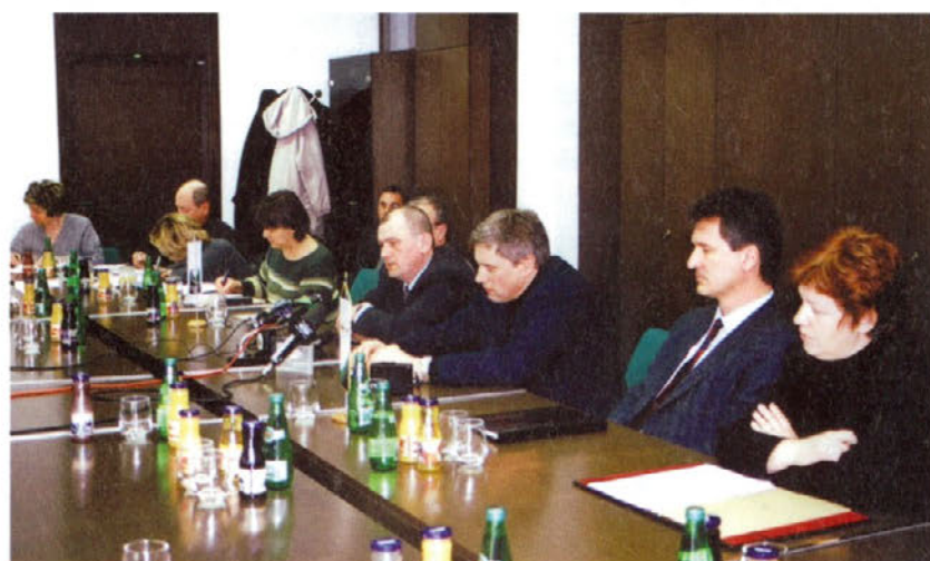
Z novinarske konference v petek, 7. februarja