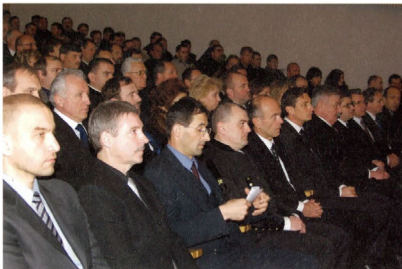
Žalne seje so se udeležili tudi predsednik republike Slovenije dr. Janez Drnovšek ter predstavniki političnega in gospodarskega življenja Slovenije.

Smrt stanovskih tovarišev je za nas velika tragedija in nenadomestljiva izguba. Obvezujemo se, da bomo vse naše znanje in napore vložili v to, da bo delo pri pridobivanju premoga v velenjskem premogovniku potekalo varno."