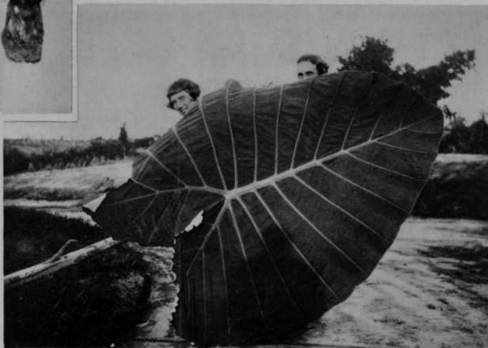
Spodaj: Na otoku Sumatra (med Azijo in Avstralijo) raste drevo „kladi“, ki ima tako velike liste, da se za enim čisto lahko skriveta dva človeka. En list zadostuje, da se postavi majhen šotor.