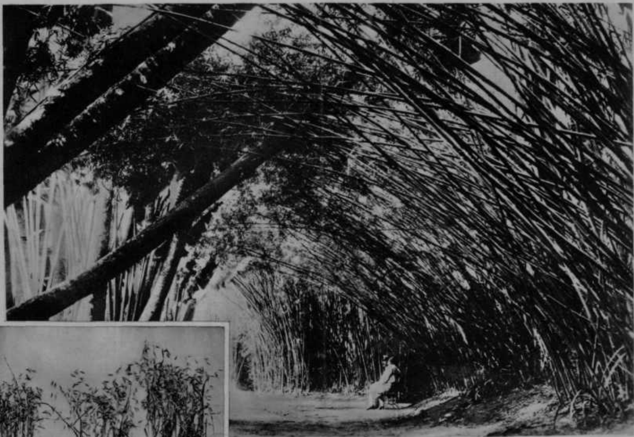
Bambusov gozd na Rio de Janeiro (Amerika). Bambusove palice so volle, zato izredno lahke, a obenem zelo močne. Dosežejo dolžino do 40 m.