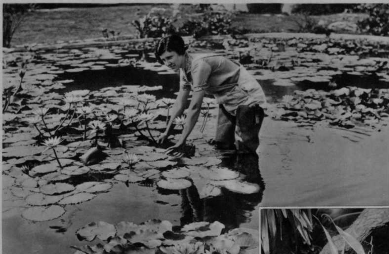
Cvetični vrt na vodi.

Imajo ga v Kaliforniji (Severna Amerika) na nekem plitvem jezeru v izmeri 4 hektarjev. V tem vrtu goje vse vrste vodnih cvetic, kakor vodne lilije i. t. d. Slika kaže skrbno vrtnarico, ki pregleduje svoje rožice. Ker silno rade gnjijejo, potrebujejo velike nege, dasi se jim ni treba bati suše in jim ni treba zalivati.