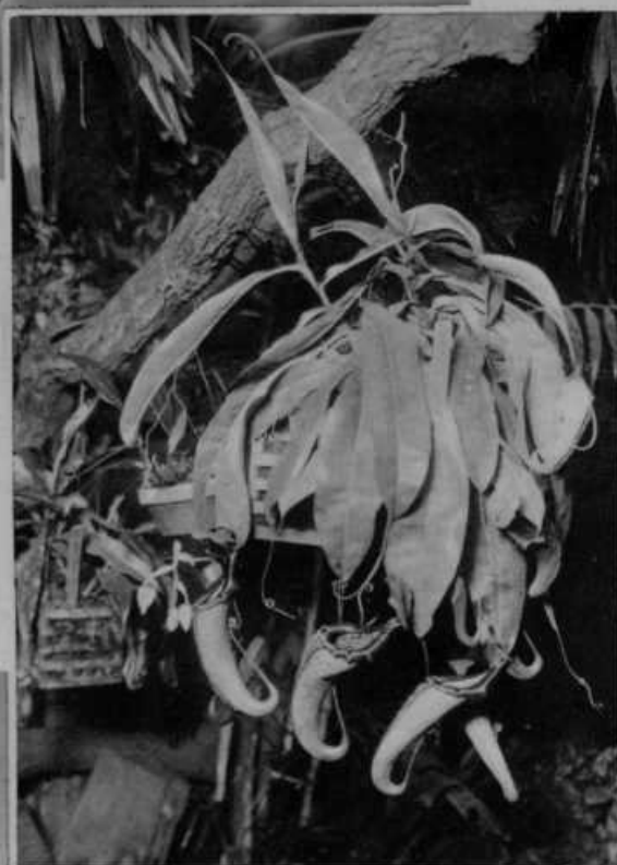
Cvetica, ki je meso.

Spodaj: Sadni vrt v obrambi proti slani. V Ameriki imajo skrbno negovane sadovnjake, ki prinašajo ogromne dobičke. Da obvarujejo cveloče drevje pred slano, prižigajo velike luči na olje, ki dajejo dovolj gorkote.