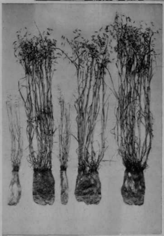
Uspehi umetnega gnojenja pri ovsu. Slike od leve na desno: 1. brez vsakega gnojenja, 2. pravilno in zadostno gnojenje, 3. gnojenje brez dušika, 4. brez fosfora, 5. brez kalija. — Iz te slike je razvidno, kako ogromnega pomena za kmeta je umetno gnojilo. Razvidno pa je tudi, da je treba gnojiti pravilno, to se pravi: vedno le tista gnojila in v taki izmeri, kakor rastlina potrebuje.