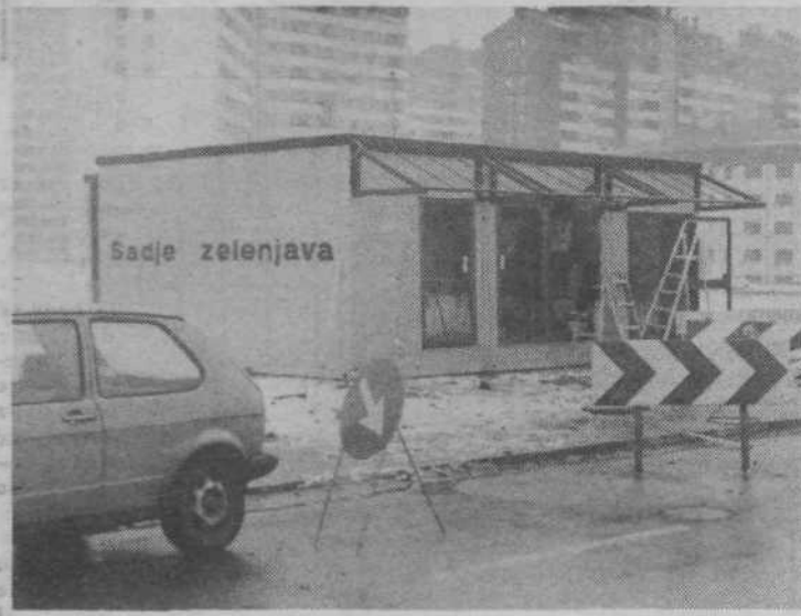
Trgovsko podjetje Mercator bo v Novih Fužinah kmalu odprlo kioski, kjer bo možno kupiti osnovne življenjske potrebščine. STANE COLARIČ