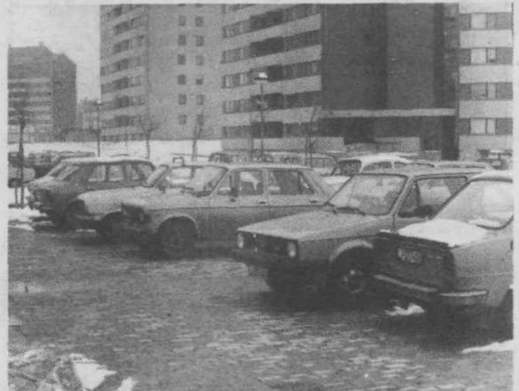
Prometna ureditev v Novih Fužinah je prav gotovo boleča zadeva. Na to mesto npr. ni moč pripeljati drugače kot s prometnim prekrškom. Kjer pa je parkiranje dovoljeno, so parkirišča prazna. Se bo našel kdo od odgovornih in uredil tudi ta problem ali bomo dopustili, da se bo ponovila slika prometno neurejene soseske za Bežigradom? STANE COLARIČ