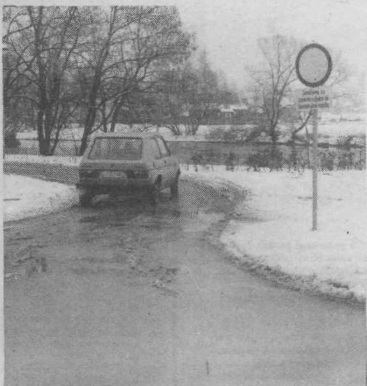
Zakaj postavljamo prometne znake, če jih ne upoštevamo!? STANE COLARIČ