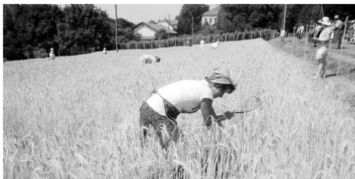
Naj žanjica Katika tik pred ciljem