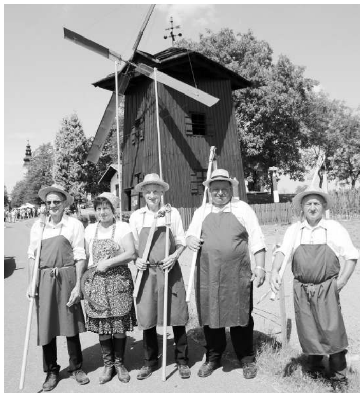
Juršinska skupina pred mlinom na veter pri Sv. Duhu