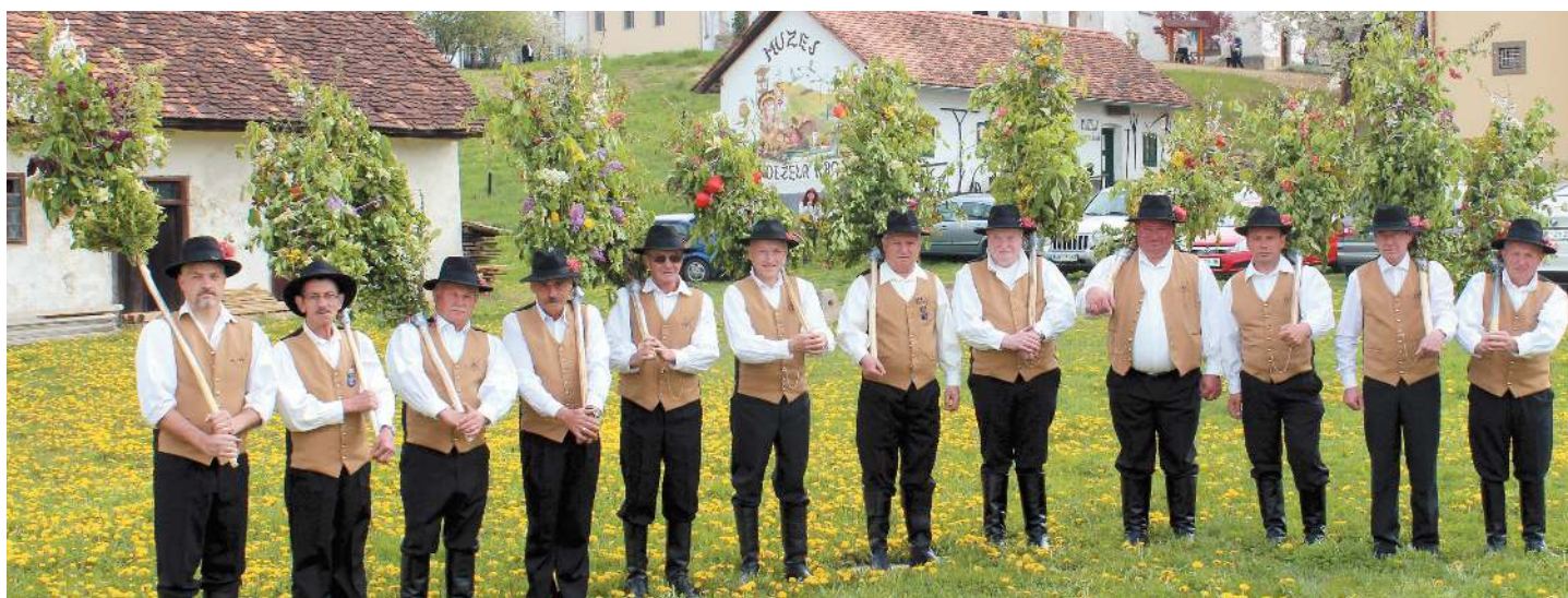
Skupina štajerskih-pesniških prazničnih noš s presmeci