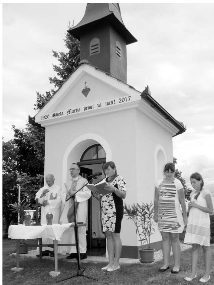
Maša in blagoslov kapele

Sledila je pogostitev – narezke smo pripravili člani TD Gomila. Nadvse pridne okoliške gospodinjice so spekle kruh in veliko peciva. Družina Žnuderl iz Senčaka je prispevala vino, člani PGD Trnovci pa so pomagali pri pripravi miz in klopi za vse udeležence. Druženje se je nadaljevalo do popoldanskih ur. Veseli smo, da se je blagoslova s sveto mašo udeležilo več kot 120 občanov. Iskrena zahvala vsem, ki ste na takšen ali drugačen način pomagali, da je kapela tako lepo obnovljena in je sedaj v ponos vsem.