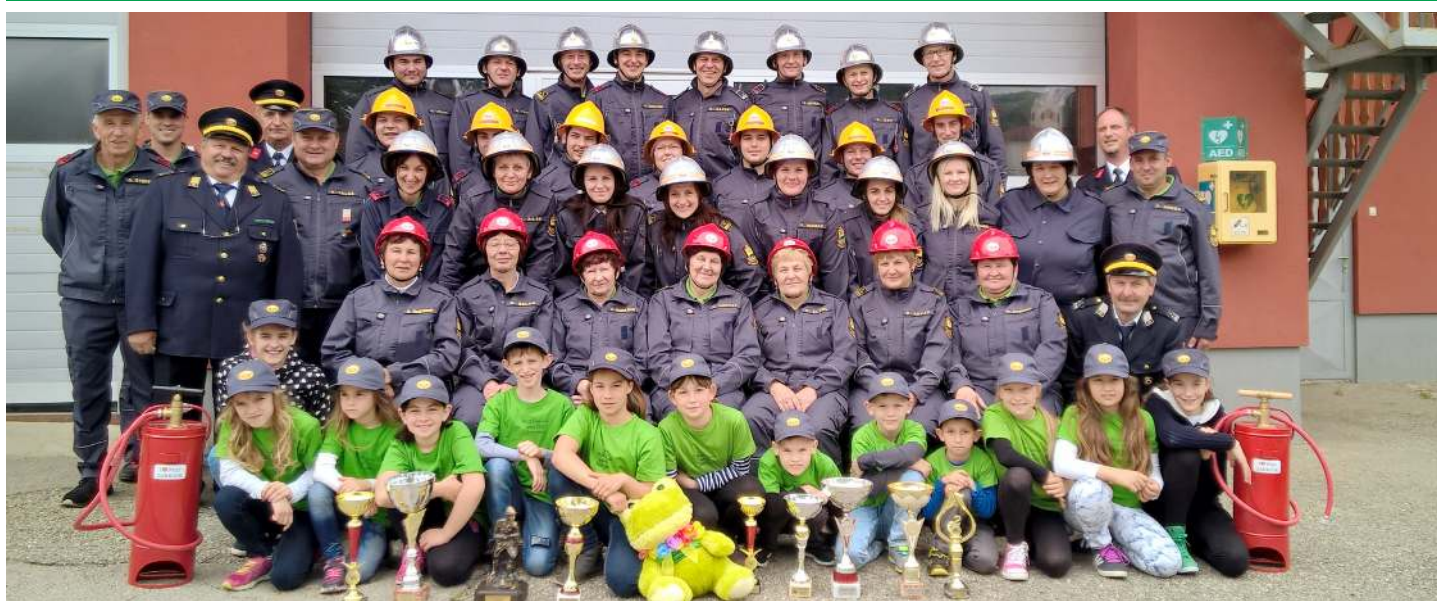
Tekmovalne enote PGD Gabrnik leta 2017