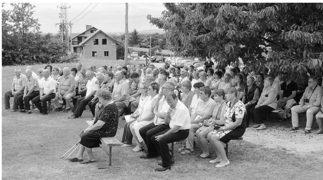
Udeleženci maše in blagoslova