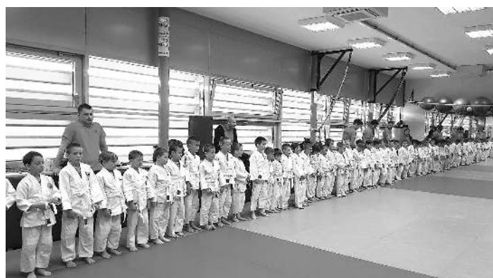
Postavitev pred začetkom tekmovanja