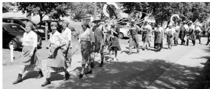
Povorka žanjic, koscev in mlatičev na njivo