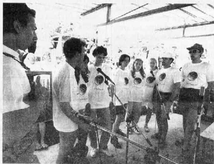
Dokjer bomo imiel takuo močne an lepe "Beneške korenine" se nam ni treba bat