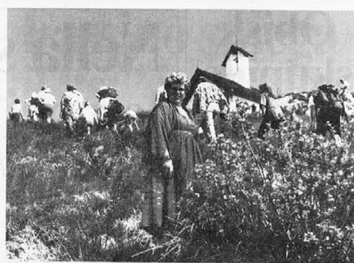
Ljudje, adni zlo hitro, drugi buj počaso, tudi zaradi močnega sonca, hodijo proti varhu, kjer se je z mašo začela lepa manifestacija

Pobude Planinske družine Benečije se je udeležilo nad 1.500 ljudi