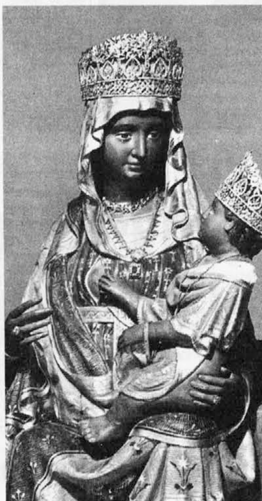
Marija na Stari Gori

La Madonna di Castelmonte, dall'alto di una nuvola, a sinistra in alto del