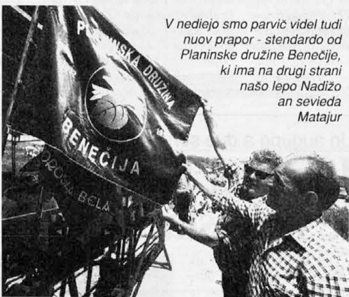
V nedeljo smo prvič videl tudi nuov prapor - stendardo od Planinske družine Benečije, ki ima na drugi strani našo lepo Nadižo an seveda Matajur

ninske družine Benečije izkazali pri organizaciji 25. jubilejnega obmejnega planinskega srečanja, pomeni, da smo bili skopi, "uohar-ni" s pohvalo. Tisoč in petsto planincev je res začutilo tisto prisrčnost in gostoljublje s strani organizatorjev, ki sta potrebna, da tako srečanje uspe in da zahtevno organizacijsko kolesje stece, ne da bi imelo kakšno vidnejšo težavo. To je bilo potrebno se posebej v popoldanskem času, ko so se planinci dvajsetih in več društev zbrali na prireditvenem prostoru, da bi sledili