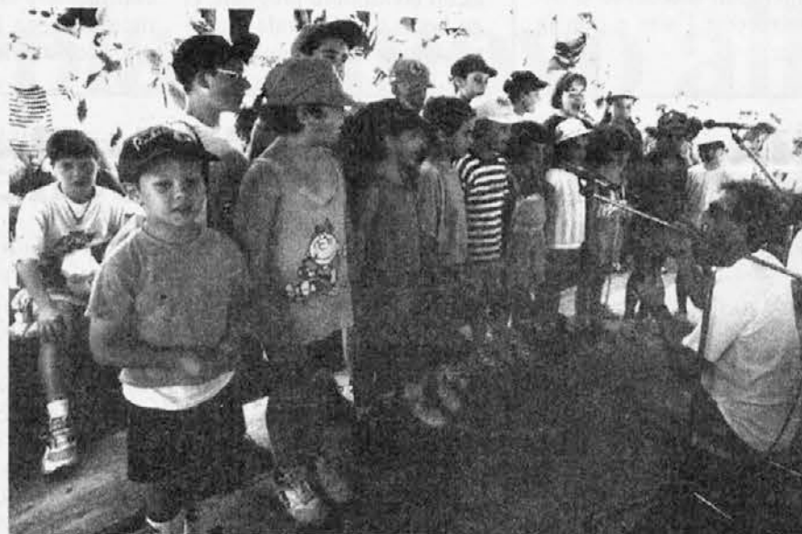
Te narbuj majhani od tistih, ki hodijo v dvojezično suolo v Spietar so tudi veselo zapiel

ninske družine Benečije izkazali pri organizaciji 25. jubilejnega obmejnega planinskega srečanja, pomeni, da smo bili skopi, "uohar-ni" s pohvalo. Tisoč in petsto planincev je res začutilo tisto prisrčnost in gostoljublje s strani organizatorjev, ki sta potrebna, da tako srečanje uspe in da zahtevno organizacijsko kolesje stece, ne da bi imelo kakšno vidnejšo težavo. To je bilo potrebno se posebej v popoldanskem času, ko so se planinci dvajsetih in več društev zbrali na prireditvenem prostoru, da bi sledili