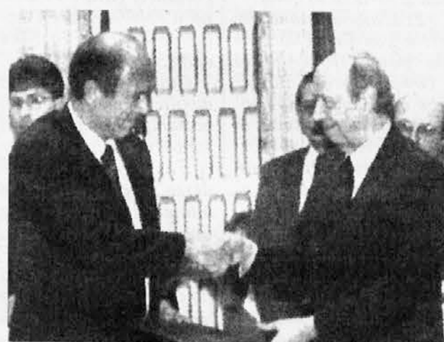
Zunanji minister Dini in slovenski premier Drnovšek

Kar zadeva redno članstvo Slovenije v EU, lahko rečemo, da se bodo pogajanja začela verjetno že prihodnje leto, končala pa naj bi se po letu 2.000. Za redno članstvo so doslej zaprosili že Ciper, Malta, Ce-