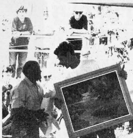
Kot je že navada so planinska društva parnesla spominska darila organizatorjem