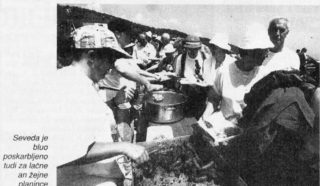
Seveda je bluo poskarbljeno tudi za lačne an žejne planince