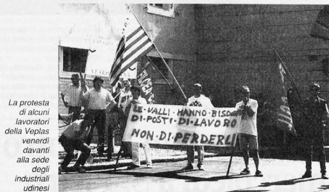
La protesta di alcuni lavoratori della Veplas venerdì davanti alla sede degli industriali udinesi

I dipendenti hanno deciso un'azione di protesta chiedendo nel contempo ai citta-