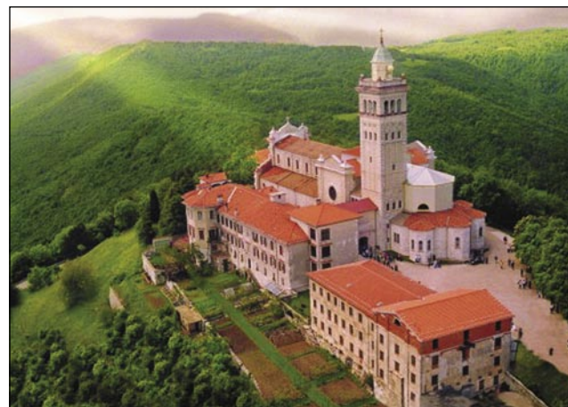
S Svete Gore letijo molitve Nebeskoj Kralici

z meki bregauv v krajini. Gestejo pa takša vina, štera majo posabno, špajsko menje: ševčica, cohovka, markaduška ali slankamenka. V Goriški Brdaj se je