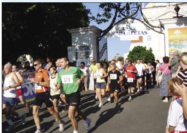
Start glavnega teka izpred monoštrske cerkve

giji Montecuccolina njim je nébo tō pomagalo. 1. augustuša kauli 11. vöre je prej strašansko velki dež prišo, voda v Rabi se je zdignila, po brgaj Rabe je pa v momenti