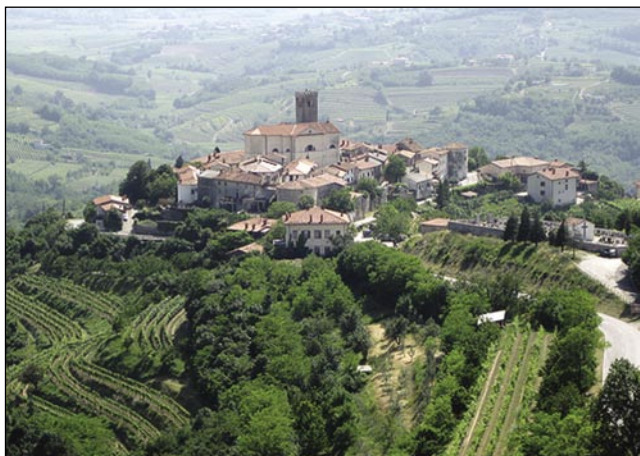
V Goriški Brdaj so vesnice kak krepki gradi

Pod bregaum se odpelamo doj z avtoceste pa se napauti-mo prauti taljanskoj grajnci.