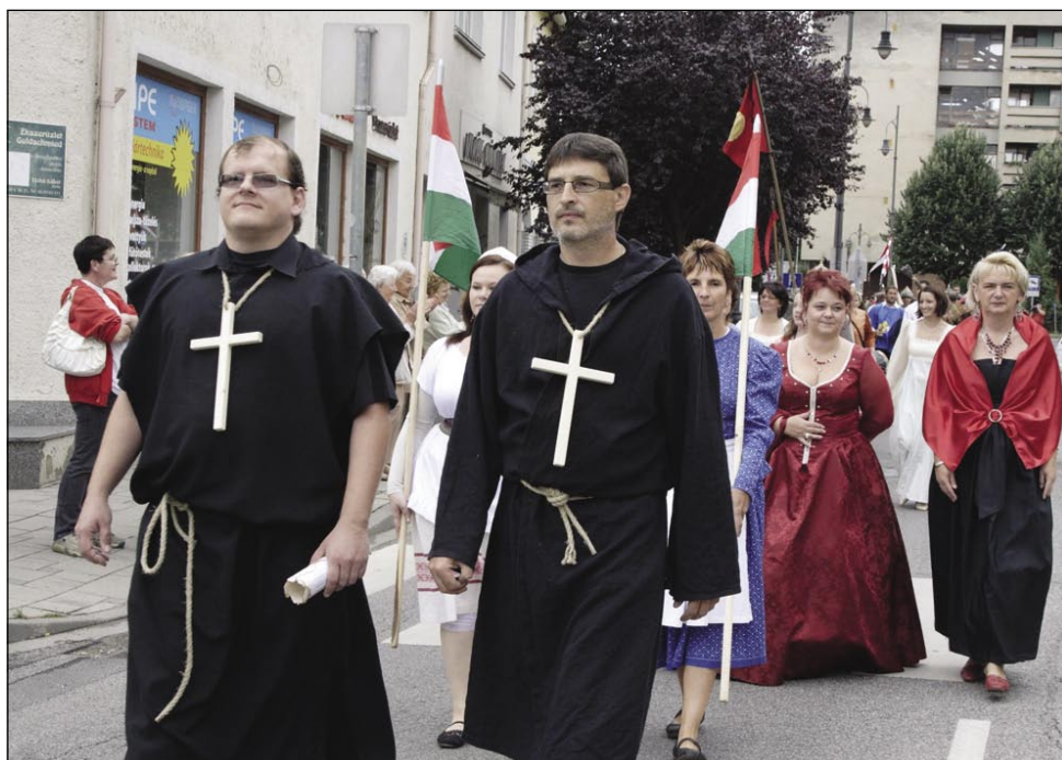
En tau povorke, stero smo si leko ogledali v petek popodneva

Nej je ovak s tejm Varaš tō nej, v Monoštri organizirajo na konci juliuša že osmo leto Zgodovinske dneve/Történelmi napok, steri so povezani s cistercijanskimi barati, steri so 1183. leta prišli v Monošter, začnili zidati svojo cerkev pa klošter. Drugi dogodek, steroga se v tej dnevaj tō spaumnijo, je bitka prauti Törkom, stera je bila pri Monoštri (Slovenskoj vesi) 1. augustuša 1664. Törška soldačija, sodakov je bilau kauli 60 gezero, je pri Slovenskoj vesi stejla priti prejk Rabe, ka bi leko svojo paut nadaljevala prauti Beči. Dapa krščanska vojska - naj bi je bilau samo kauli 20 gezero - je Törke stavila. Ob dobri sodački strate-