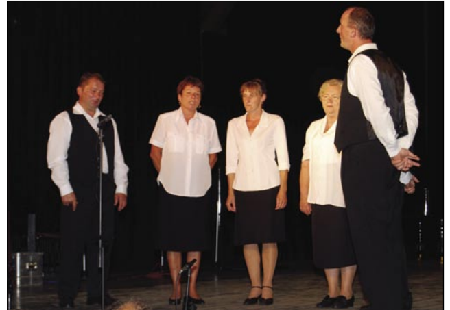
Gorenjesenički ljudski pevci na odri

Sobotni večer je biu namenjeni Slovencom, steri živémo zvüna Slovenije. Nejsa se nutpokazale samo folklorne skupine, liki ljudski pevci tó. Iz Porabja sta bili tau Folklorna skupina pa ljudski pevci ZS z Gorenjoga Senika. Ljudski pevci smo ejk-