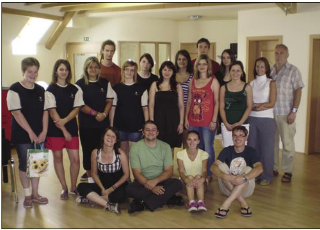
Dijaki in sodelavci TV AS