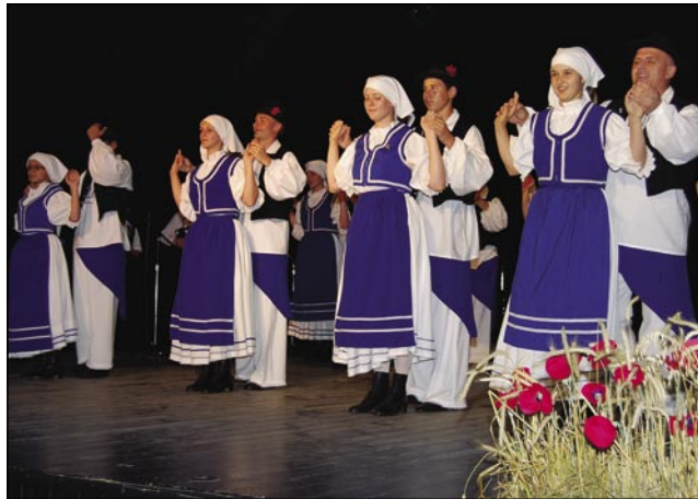
Gorenjesenička folkora ma dosta mladi plesalcev

V tom leti je sploy nika nauvoga bilau tau, ka so v Betincaj, pod pokroviteljstvom ministra za Slovence v zamejstvi in po svejti dr. Boštjana Žekša pripravili večer, šteromi so imé dali Onkraj meje . Tak so se v kulturnom daumi, kama so zavolo dežja preselili prireditev, ob seničkih plesalcih notpokazali eške ljudski pevci iz največše porabske vesnice, pouleg