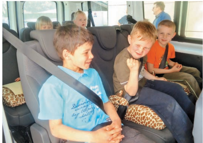
Otroci so se razveselili novih »jahačev« (otroških varnostnih sedežev), ki zagotavljajo večjo varnost med vožnjo v šolskem kombiju.