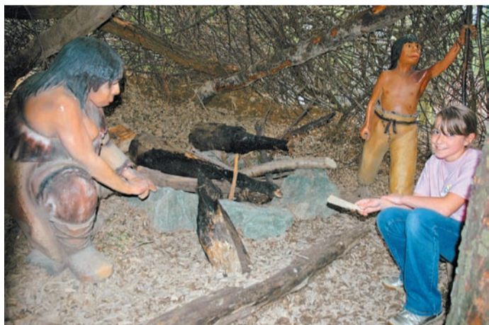
Dinozavrom so se pridružili tudi velikani in prebivalci ledene dobe. Življenje jamskih ljudi – neandertalcev, prikazano v votlini, narejeni z debli dreves in vejevjem, je še posebej zanimivo šolarjem.