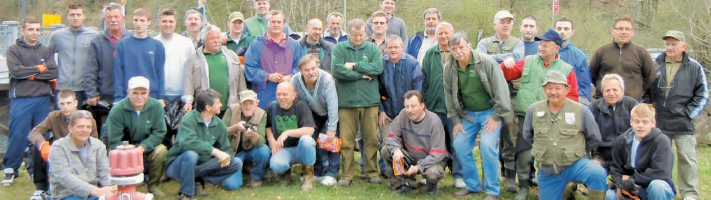
Čistilnih akcij se vselej udeležujejo ribiči, ki so se letos zbrali na glavni avtobusni postaji v Kamniku.

Krajevne skupnosti, šole, vrtci, društva, upravniki stanovanjskih blokov so tudi letošnje pomlad organizirali čistilne akcije na svojih območjih. Občina Kamnik je, tako kot vsako leto, priskrbela črne vreče za zbiranje mešanih odpadkov, rumene vreče za zbiranje odpadne embalaže in rokavice za udeležence čistilnih akcij ter poskrbela za odvoz zbranih odpadkov. Koncesionar Publicus d.o.o. je odpadke, zbrane na posameznih zbirnih mestih, odpeljal takoj po končanih akcijah. V vseh letošnjih čistilnih akcijah je bilo skupaj zbranih 21.420 kg odpadkov; od tega je skoraj polovica kosovnih odpadkov.