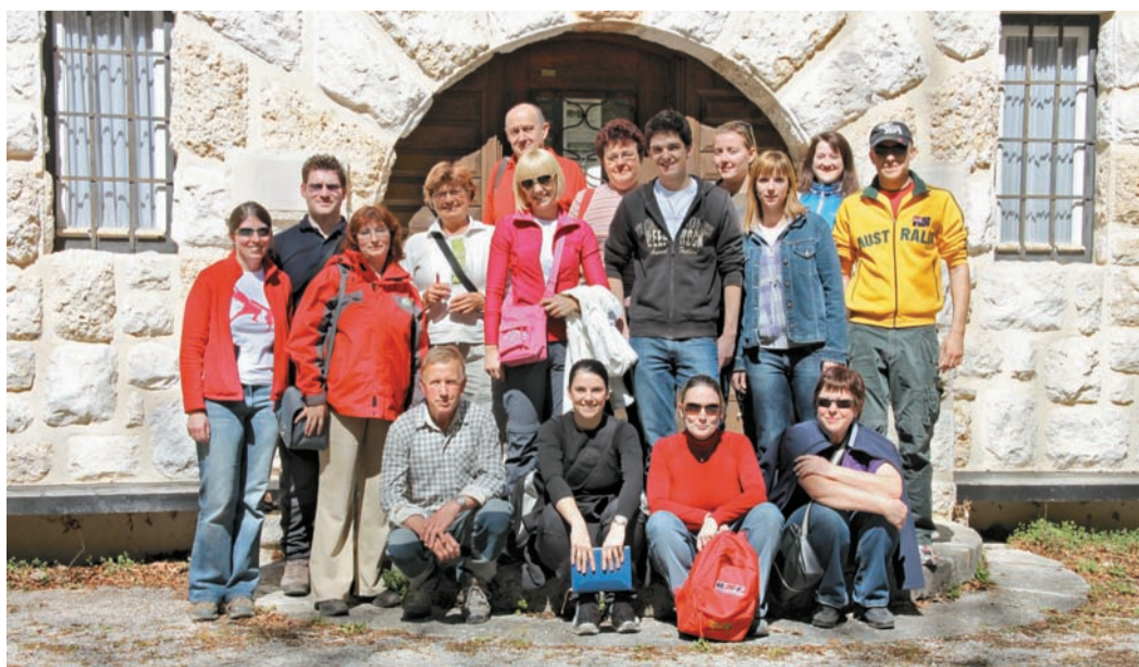
Tokratno študijsko turo so lokalni turistični vodniki iz območja Srca Slovenije zaključili pri Plečnikovem dvorcu v Kamniški Bistrici.