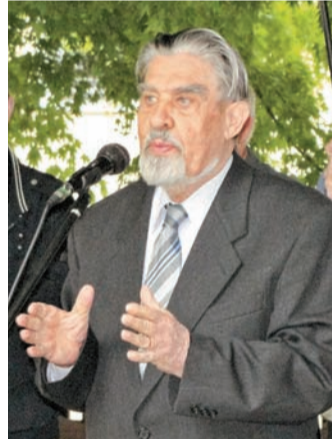
Slavnostni govornik Ciril Zlobec je poudaril, da naj bo povezanost slovenskega naroda v preteklosti tudi vodilo v današnjih situacijah.

Slavnostni govornik dogodka, akademik, pesnik in pisatelj Ciril Zlobec se je v svojem govoru spomnil svojih prvih uporov proti fašizmu že v šoli, iz katere je bil izključen tudi zaradi pisanja slovenskih pesmi. Poudaril je, da je partizansko obdobje v njegovem življenju eno najsvetlejših obdobjih, saj so bile takrat poštenost, tovarištvo in