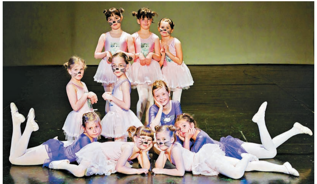
Učence Plesne pripravnice 2 iz podružnice Komenda Moste so navdušile s prikupno in izvirno plesno točko.

Baletni koncert mladih kamniških plesalk je ponovno navdušil, saj je bila dvorana Doma kulture Kamnik v torek, 19. aprila, prepolna. Zato že razmišljamo o dveh izvedbah koncerta, s čimer bi gledalcem ponudili možnost izbire terminov in verjetno bi bil obisk še večji, s tem pa bi balet, ki bogati kamniško plesno sceno, postal še popularnejši.