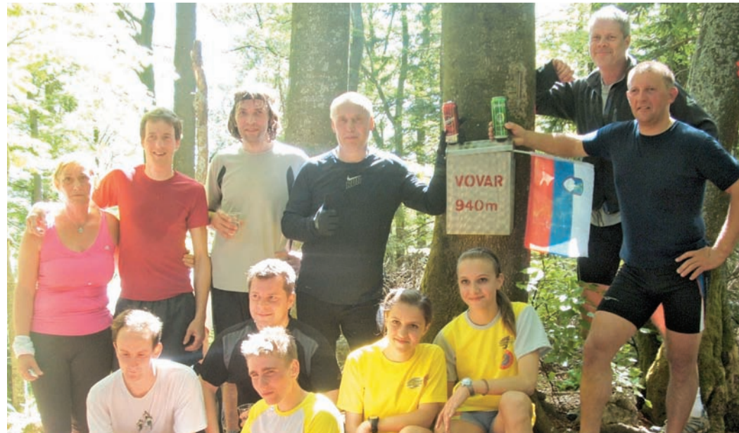
Enajst drznih tekačev se je pomerilo v teku do vrha Vovarja, priljubljenega vaškega 940-metraša. Koliko priprav, vztrajnih treningov, prelitega potu, pa tudi besed in smeha je na teh poteh, vedo le oni, a dobra volja je vselej prisotna. Veselo je bilo tako na »stekmi«, kot tudi na veselem druženju krajanov pod Zvržinovim toplarjem.