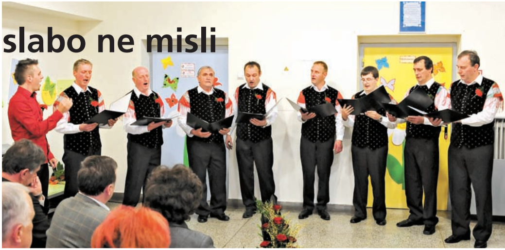
Pevsko društvo Tunjiški oktet, ki letos praznuje 25 let svojega delovanja, nam je v aprilu pripravilo nepozabno pevsko doživetje v avli Osnovne šole Tunjice, kjer so imeli pred mnogimi leti tudi prvi samostojni koncert.

Vsako leto v maju prirejujejo srečanje oktetov Pozdrav Mariji, kjer so se zvrstili številni okteti in male vokalne skupine – Slovenski oktet, Ljubljanski oktet, Bratje Pirnat,