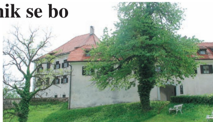
Grad Zaprice. Sedež Medobčinskega muzeja Kamnik.

Intenzivno delamo na prenovi stalne razstave v pritličju muzeja z naslovom Kamniško območje skozi stoletja , ki jo bomo odprli jeseni. Prvič bomo v razstavo vključili bogato geološko dediščino - fosile (delno iz naše zbirke, delno izposojene); arheološke predmete, ki doslej še niso bili deležni posebne pozornosti (precej pa jih je prišlo na dan v zadnjem desetletju). Na zanimiv in sodobnejši način bomo skušali predstaviti družbo posameznih obdobj, politične, socialne, gospodarske razmere, promet, kulturo, umetnost, arhitekturo in vsakdanje življenje do 19. stoletja. Izpostavili bomo bogato ljudsko izročilo, pripovedke in legende ter