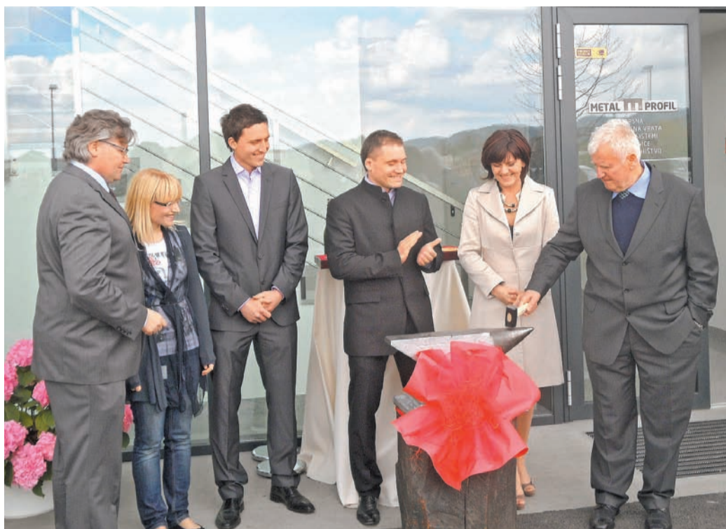
Juhantovi so nove prostore družinskega podjetja Metal-profil v kamniški poslovni coni na Korenovi cesti, kamor so se preselili konec lanskega leta, 15. aprila slovesno predali namenu in jih predstavili poslovnim partnerjem in javnosti.