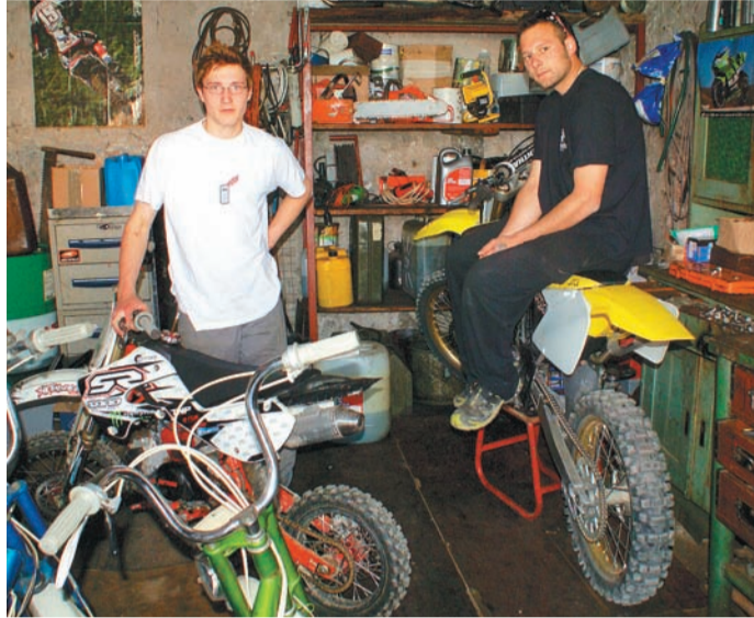
Rok in Blaž

Med običaji ob prvem maju je tudi prvomajska budnica, ki se izvaja na različne načine in z različnimi sredstvi. Mestna godba Kamnik, ki prvega maja prevozi celotno področje občine Kamnik, budi krajane z igranjem glasbe. Svojo pot prične ob 4. uri zjutraj z Glavne trga v Kamniku in jo konča ob 11. uri dopoldan na prizorišču osrednje občinske prvomajske prireditve v Kamniški Bistrici. Zelo zgodaj pa 1. maja ne vstajajo le kamniški godbeniki, temveč tudi motoristi. Sokrajanov sicer ne budijo v organizirani obliki, temveč v manjših, a še kako glasnik skupinah.