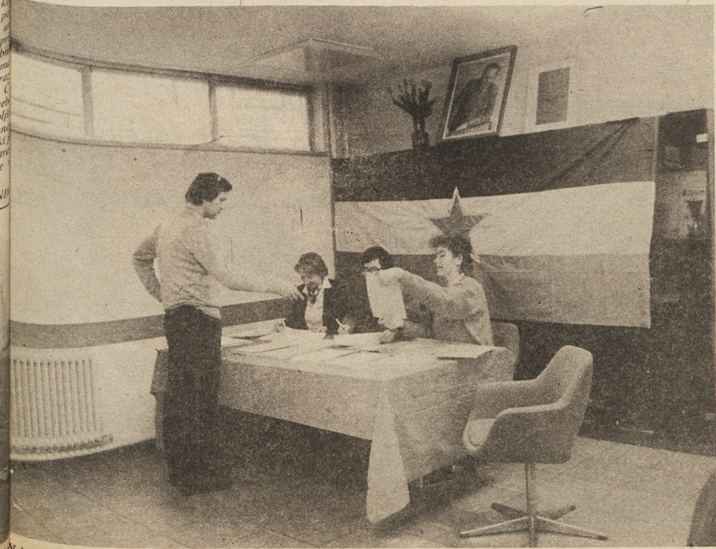
Volitve v DO Promot