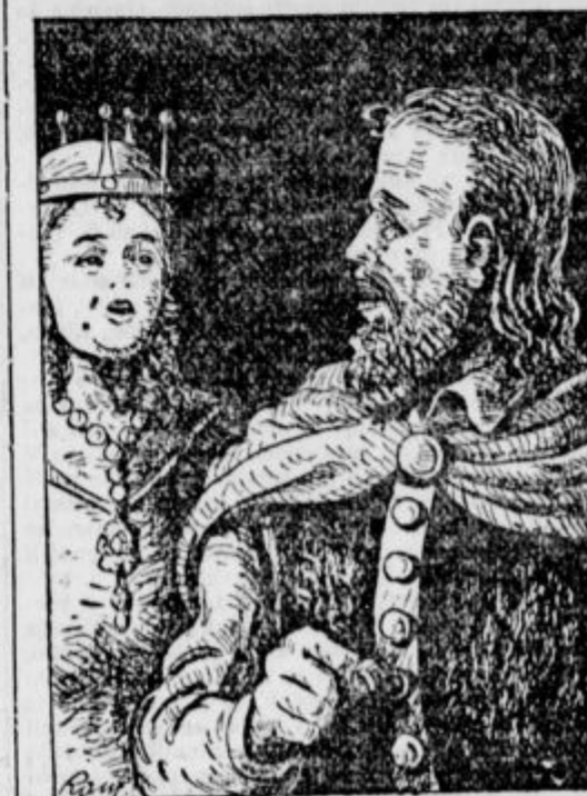
KO PRIDE IN VIDI, KAJ SE JE ZGODILO, SE RAZSRDI NA KRALJICO. ONA PA MU POKAŽE PISMO: OGLEDUJE PISAVO, PEKATE, VSE JE BILO NJEGOVO, LE VSEBINA POVSEM DRUGAČNA.