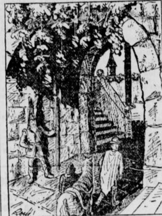
ČEZ NEKAJ DNI SE VRNE KRALJ DOMOV.