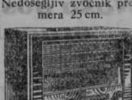
D 707 WKK

Razkošni super s 7 jeklenimi elektronkami in 7 vglasenimi krogi. Predstopnja s posebnim vhodnim krogom. Ima napravo za avtomatično nastavitev postaj s 10 tipkami ter dvojne kratke valove od 13,7 m dalje. Opremljen je z vsemi tehničnimi odlikami, izhodna energija 8 vatov.