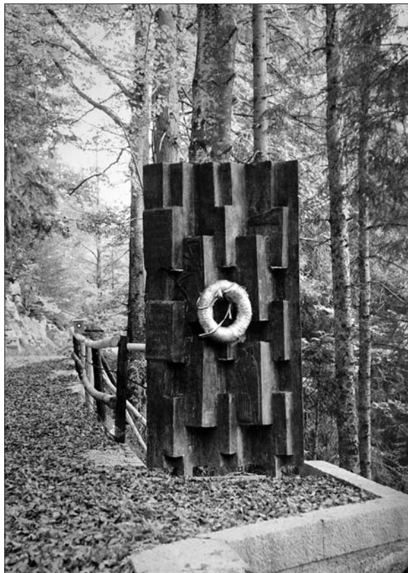
Bronasti spomenik Stojana Batiča.

Ohranjanje spomina na spopad pri Jelenovem Žlebu je dobilo potrditev oziroma je Jelenov Žleb postal kraj spomina najkasneje s postavitvijo bronastega spomenika po ideji Stojana Batiča 22. junija 1958, torej dobrih 15 let po spopadu. V okviru ohranjanja tradicije in vzpostavljanja kraja spomina so po bitki pri Jelenovem Žlebu poimenovali tudi ulico v Beogradu, in sicer v krajevni skupnosti Savski venac. 80