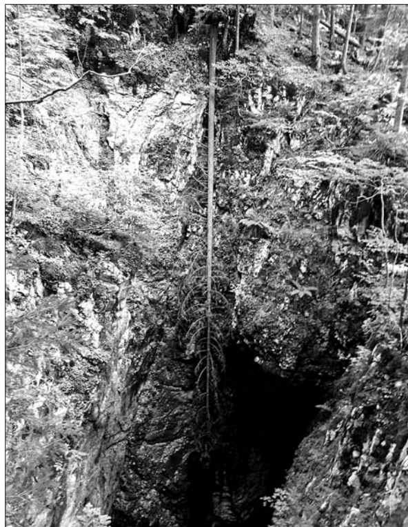
Brezno pod cesto, ki vodi k Jelenovemu Žlebu.

Italijanske smrtno žrtve spopada lahko – glede na usodo njihovih zemeljskih ostankov – vsaj po poročilih v arhivskih virih razdelimo v tri skupine. Prvo predstavljajo padli na samem območju spopada. Iz ohranjenih pričevanj je znano, da so bili med številnimi italijanskimi vojaki, ki so v spopadu obležali na ožjem območju bojev, tudi ranjenci. Nekaj so jih italijanski soborci očitno rešili že med umikom, čeprav naj bi italijanske enote ob pobiranju mrtvih naslednjega dne reševale tudi ranjence. Iz arhivskih virov ni mogoče jasno razbrati podatkov o ravnanju zmagovalcev bitke s to kategorijo žrtev spopada; 58 o njihovi nadaljnji usodi lahko torej glede na naravo