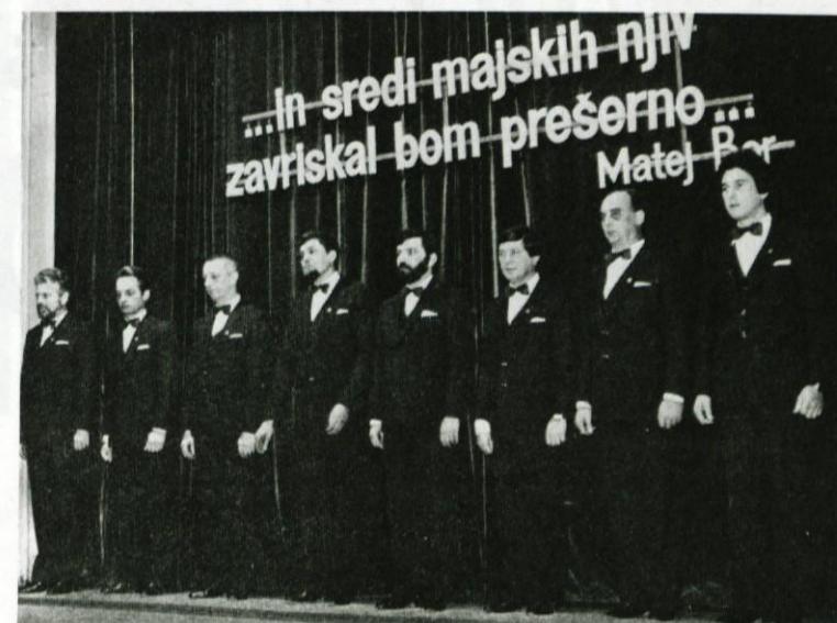
Logaški oktet, gostitelj lepo obiskanega koncerta

Oktet pri svojem pevskem udeleževanju tudi ni zaprt sam vase, temveč vabi v našo sredino vedno nove pevce. Tako smo imeli letos, 3. aprila, v gostovanju Ljutomerski oktet.