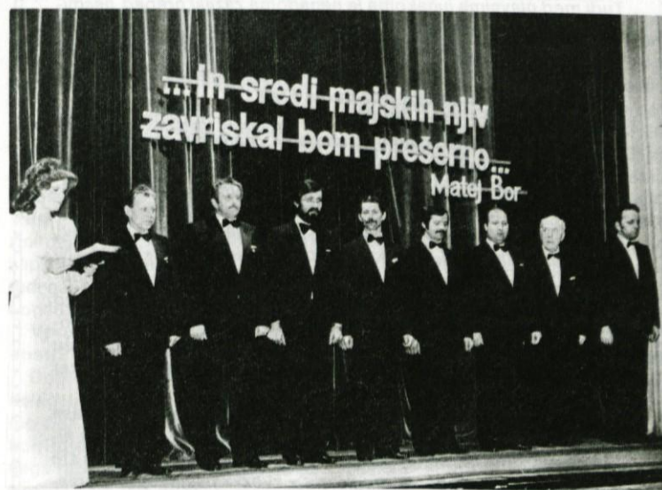
Ljutomerski oktet se je v Logatcu prvič predstavil