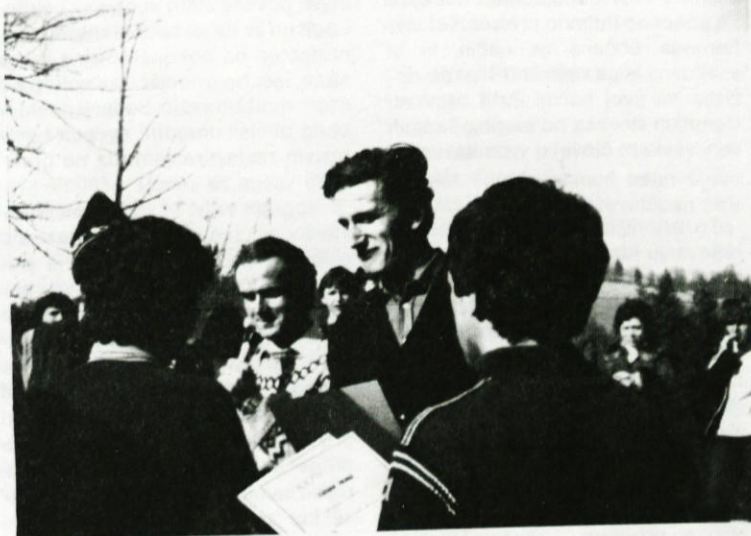
Podelitev priznanj in diplom