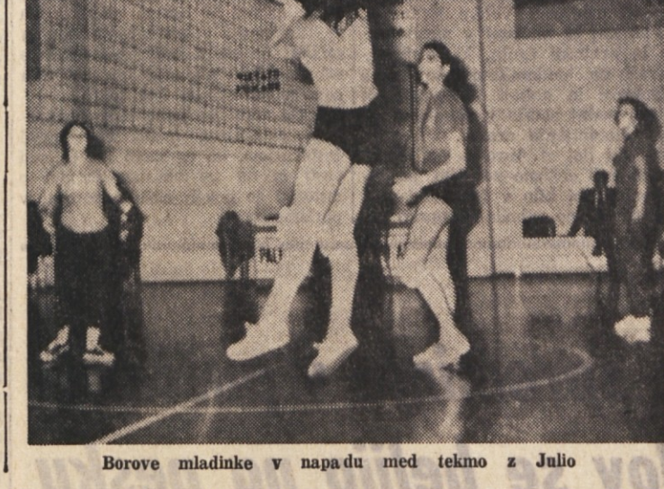
Borove mladinke v napadu med tekmo z Julio

SODNIKA: Dal Fovo in Gilleri iz Trsta. PROSTI METI: SABA 5:12, Bor 4 proti 20. Pet osebnih napak: nihče.