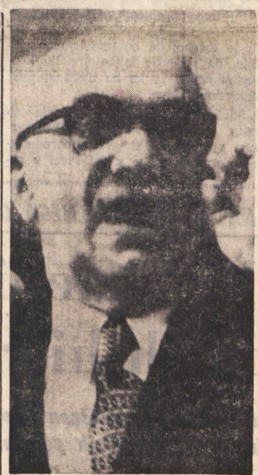
Tajnik KD Fanfani

Podobne pomisleke je danes izrazil tudi član vodstva PSDI Averardi, ki je poudaril hude gospodarske težave, s katerimi se ukvarja država, od energetske krize in deficita plačilne bilance, do naraščanja cen in racionaliranja bencina. V takem položaju — pravi Averardi — pa se vosem čje upoštevamo hudo družbeno in gospodarsko krizo, ki jo država preživlja.