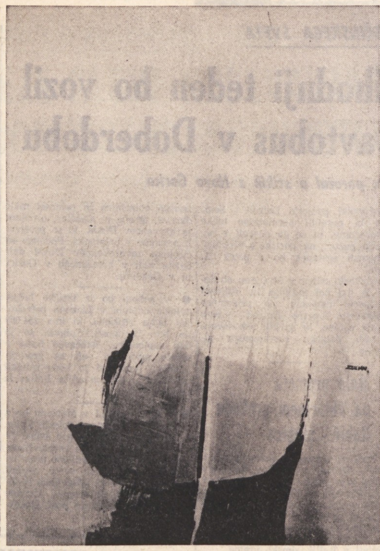
«Belo zelenje» (olje 1973) — Boris Zuljan

Zakaj vsebina osnovnega sporazuma, kot nasploh vseh evropskih sporazumov — moskovskega, varšavskega, praškega — je priznanje in legalizacija obstoječih meja, kar naj bi bila izhodna točka organiziranja miru in sodelovanja v Evropi.