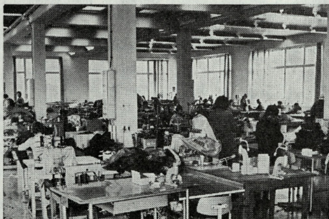
Šivalnica v TOZD Proizvodnja pletenin Bohinja, v kateri so delavke zadovoljivo opravile priučevanje na delovnih fazah krojenje metraže in delov, overlock, ročno šivanje in pregledovanje. Priučevanje poteka le še na fazi verižkanje.