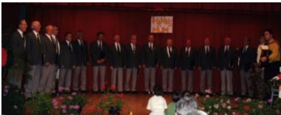
Moški pevski zbor Planika poje materam za praznik.

v petek, 10. maja, sveto mašo ob materinskem dnevu. Somaševala sva s patrom Nikom.