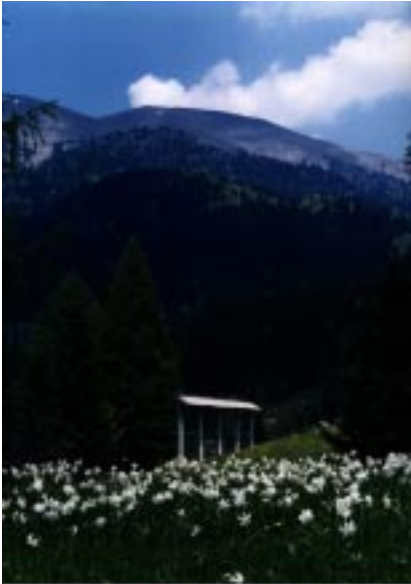
Cvetoči maj pod Golico.