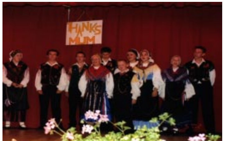
Folklorna skupina Iskra je popestrila praznovanje materinskega dne v Kew.