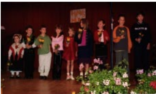
Otroci Slomškove šole iz Kew voščijo materam

The most obvious reason would be that it is impossible to simply have a 'Mother's Day' – because Mothers deserve two 'Days'. Either that or Kew thought they would make it before Mother's Day, so that our mums could have a sleep in.