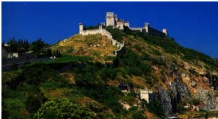
Mogočna trdnjava Rocca Maggiore nad mestom Assisijem.