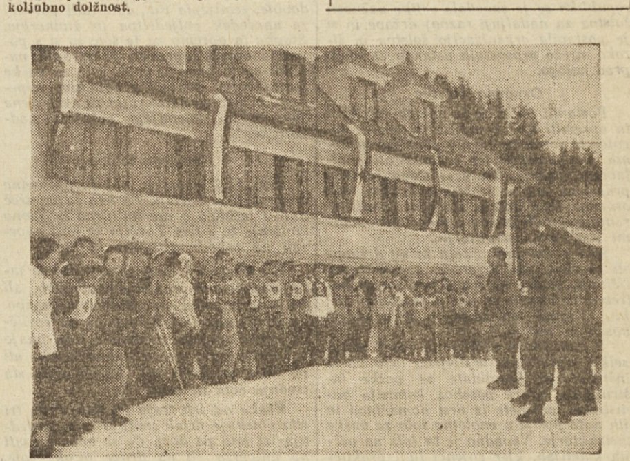
Na Pohorju je bilo v nedeljo četrto smučarsko prvenstvo graficarjev Jugoslavije. Sodelovalo je več kot sto tekmovalcev in tekmovalk iz Maribora, Celja, Ljubljane, Kranja, Zagreba in Beograda...