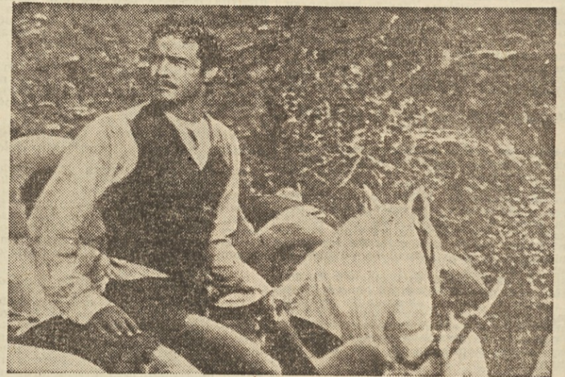
Prizor iz filma »Viva Zapata«

Ljudski junak Emilijo Zapata v tem filmu ni prikazan kot nadčlovek brez napak, ampak samo kot človek, ki ni mogel trpeti krivice.