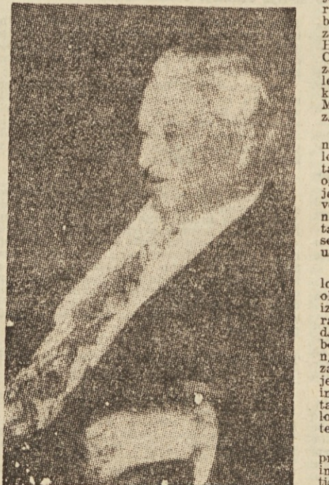
Senator Pat Mc Carran oholo sedi pred sodniki. Kdo mu kaj more, saj ima vendar za seboj bogataše — gospodarje ameriške dežele

Proti Mc Carranovemu zakonu je tudi protestirala večina držav Zahodne Evrope in značilno je, da so bili prav socialisti tisti, ki so prvi in najbolj odločno dvignili svoj glas.