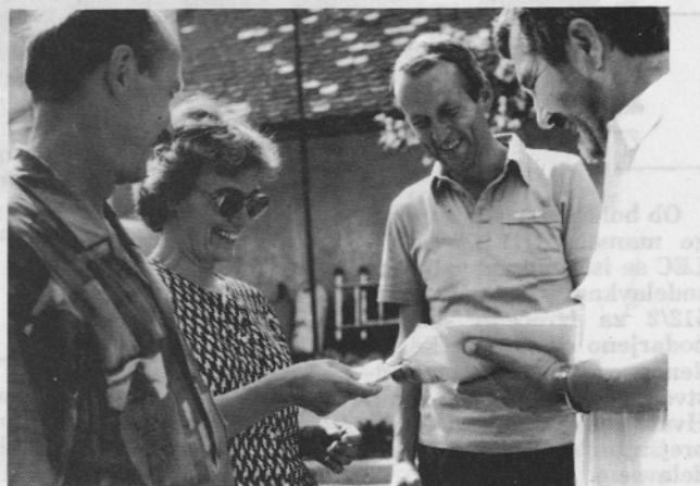
Na razglasitvi so podelili tudi značke planincem, ki so prvi prehodili PLANINSKO POT PEKO

»Šušarska nedelja« na tržnici, igra ansambel POP DESIGN