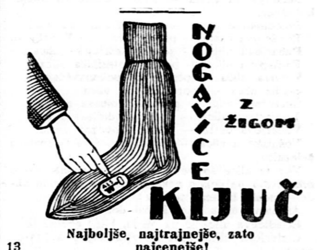
Najboljše, najtrajnejše, zato najcenejše!

Nujno je potrebno, da poklicani činitelji, slovenski narodni poslanci, oblastni odbor ter ljubljanska občina pokrenejo novo akcijo za čim prejšnjo ureditev tega perečega vprašanja.