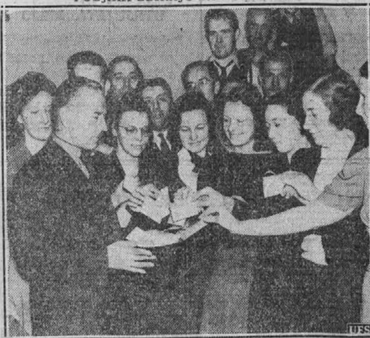
Za staro domovino, Poljsko, ogroženo od Hitlerja, so se zavzeli uslužbenci nekakega poljskega lista v New Yorku in prispevali tedensko plačo, da se pošlje Poljski za ojačenje njenega obrambnega sklada.