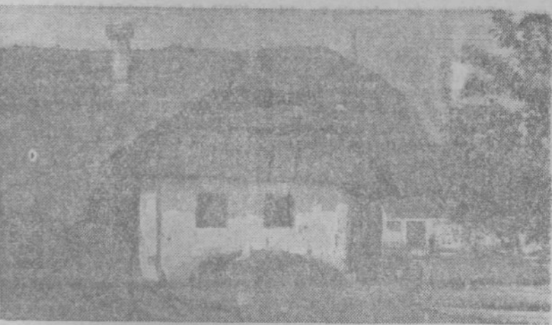
Sinovci iz skromnih domov niso smeli obiskovati gimnazije