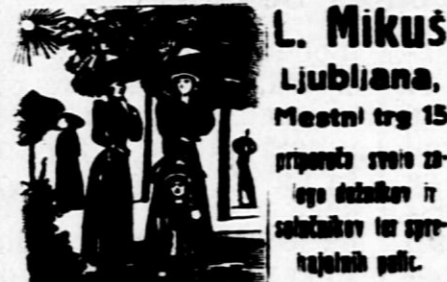
L. Mikuš Ljubljana, Mestni trg 15

Prometni zavod za premog d. d. v Ljubljani. Miklošičeva cesta 15/1