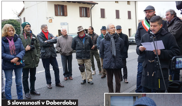
S slovesnosti v Doberdobu