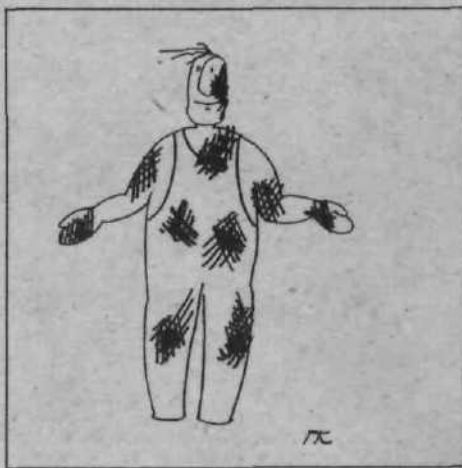
– Govorite o umazanih poslih s pralnimi praški? Jaz sem čist!