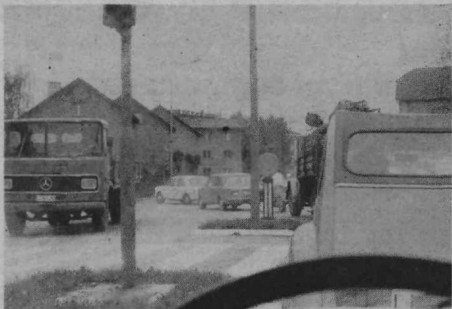
V letošnji junjski številki našega glasila smo poleg zgornje fotografije zapisali članek z naslovom »Bomo počakali na prve žrtve?« Zrtev na srečo ni bilo. Bralci se varjetno še spominjajo, da smo kritizirali neurejeno in nevarno semaforizacijo križišča Topniške in Linhartove ceste. Spodnja fotografija je bila posneta pred kratkim in prikazuje zdaj vzorno urejeno križišče, kjer vozniki, ki prihajajo iz moščanske smeri ter zavilajo v levo lahko mirno počakajo, da se jim prižge rumena luč na nasprotnem levem semaforu, tako da lahko brez bojazni prevozijo križišče. Vrh tega pa so vrli komunalci namestili še poseben semafor z zeleno dodatno puščico, ki usmerja levo vozeče voznike, da lahko zapeljejo v križišče, medtem, ko je pot zaprta. Kot kaže, je k hitrejši opremljenosti križišča pomagala tudi junjska številka našega glasila. Eppur si mouve!