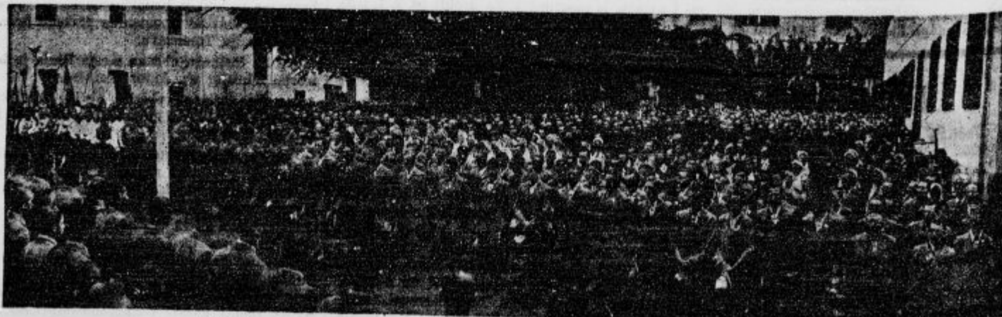
Pogled na del ogromne množice, ki se je udeležila tabora pri Sv. Trojici v Slov. goricah.