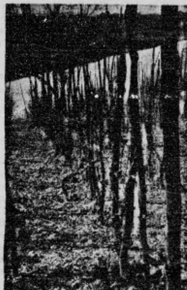
Uniženi vinogradi na Bizelskem.