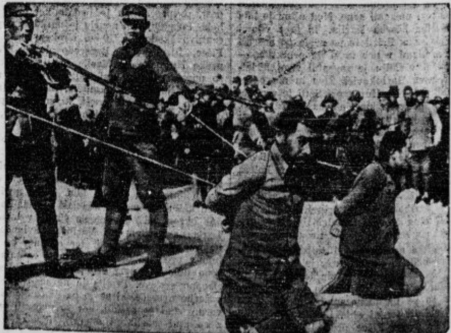
Tako kasnujejo Japonci prave in namišljene vojune.

» Nevarno je zbolel neustrašeni voditelj slovaškega naroda msgr. Hlinka.