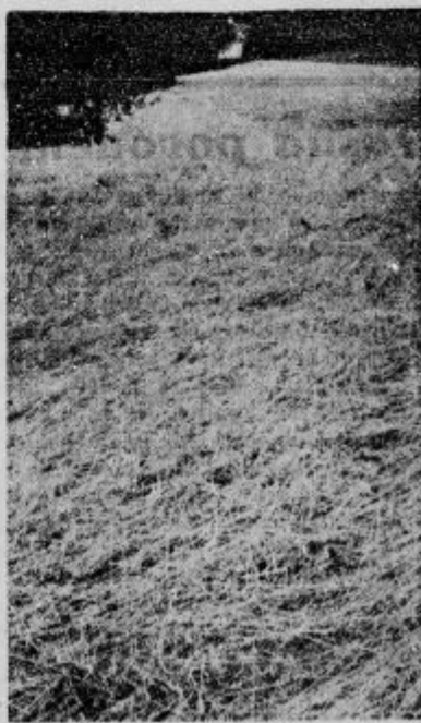
Pomandrano žito v Pavlovi vasi. Toča je žito zbil. v zemljo tako, da ga ni mogoče niti kositi.

svoj dolžnost do vsakega teh izseljencev. Ugotoviti moramo, da napredujemo. Ustanovitev izseljenske zbornice je tak napredek in lahko rečemo, zgodovinski dogodek. V imenu kraljevske vlade ji želim lep napredek in prav tako v imenu kr. vlade izrekam dobrodoščilo ameriškim bratom od onkraj morja, ki jih bratsko stiskamo na svoje grudi. Pozdravljam pa tudi vas, ki se danes trudite za izseljensko vprašanje.