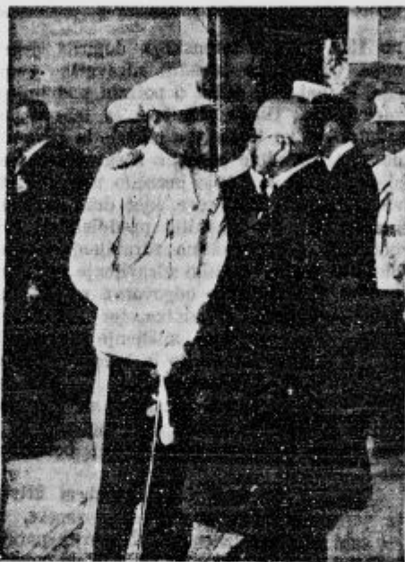
Knez-namestnik Pavle in minister dr. Korošec se pogovarjata.

varnost preboleli. Da bi se ugotovila vrsta strupa, je oblast odredila izkop obeh mrtvih delavcev.