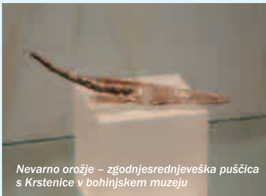
Nevarno orožje – zgodnjersrednjeveška puščica s Krstenice v bohinjškem muzeju

Ljudsko izročilo na primer pripoveduje, da je v Stiški vasi živel v bližnji kraški jami divji mož, ki je Stičane učil umnega kmetovanja. Ar-