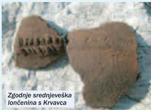
Zgodnje srednjeveška lončenina s Krvavca

arheološka izkopavanja. Iz ustnega izročila je sklepati, da je obstajal stik med staroselci in priseljenci. Očitno so živeli skupaj na istem območju.