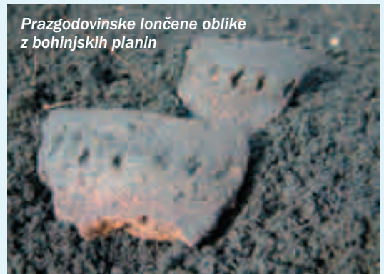
Prazgodovinske lončene oblike z bohinjških planin

Lončenina iz pozne antike ter zgodnjega srednjega veka govori o prisotnosti človeka tudi v času, usodnem za staroselsko prebivalstvo. Srečevanje in prenos izročila se kažeta v zgodbah o »dovjih možeh«, ki so, če geografsko pogledamo najdišča, živeli dejansko na območjih, kot jih omenja ustno izročilo, potrjujejo pa ga