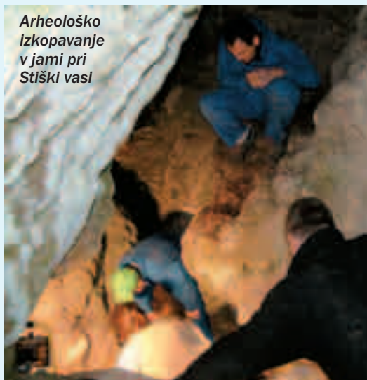
Arheološko izkopavanje v jami pri Stiški vasi

Lokacije na planinah z najdenimi gradbenimi ostanki iz prazgodovine segajo nazaj do obdobja pozne bronaste dobe prek stare železne do-