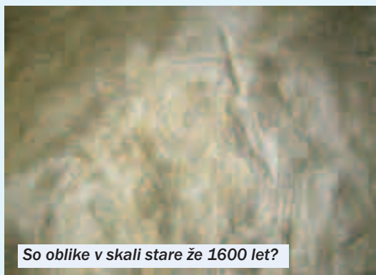
So oblike v skali stare že 1600 let?

Dosedanja sondiranja, arheološka izkopavanja in naključne najdbe še ne potrjujejo stalne in nepretrgane prisotnosti človeka na naših pla-