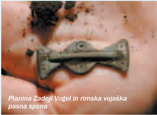
Planina Zadnji Vogel in rimska vojaška pasna spona

tako kot je to dokazano z blejskimi zgodnjersrednjeveškimi grobovi. Za naše gore in predgorja so znani tako divji možje (dovji možje) kot divje žene, bele žene, vile rojenice, ajdovske deklice itd.. Posredovali niso samo pozitivne telesne posebnosti ter oblačilne navade, ampak tudi znanja o najpomembnejših življenjskih rečeh (poljedelstvu, lovu, rojevanju otrok ...).