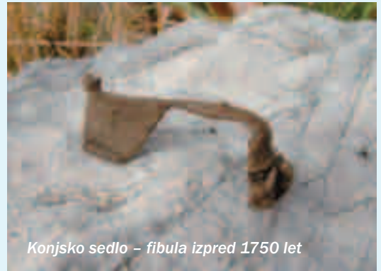
Konjsko sedlo – fibula izpred 1750 let

Ustavimo se še pri izročilu Velike planine. Velika planina je skorajda eno samo veliko arhe-