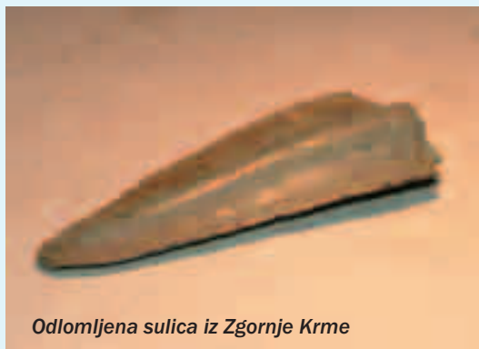
Odlomljena sulica iz Zgornje Krme

V Julijcih je slika nekoliko drugačna. Nekaj na račun slabše raziskanosti, nekaj dejstev pa govori o drugačnem načinu zahajanja v gore. Tu se skoraj praviloma prazgodovinski ostanki