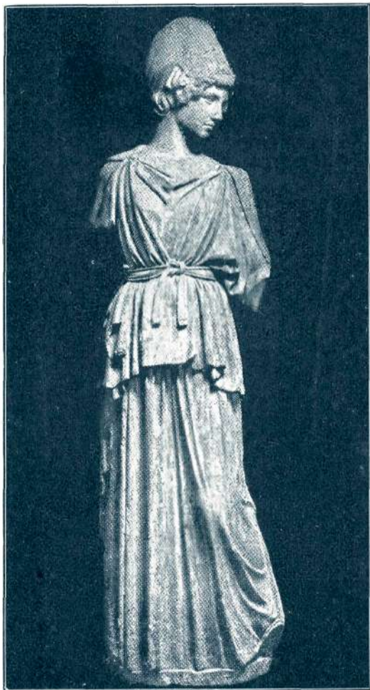
Sl. 35. Atena iz skupine z Marsijem (marmor po bronu). Myron, okrog 450 pr. Kr. Frankfurt ob M.