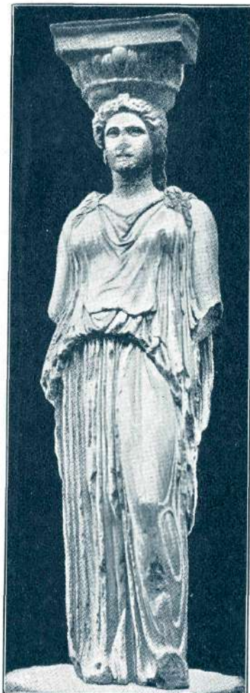
Sl. 36. Kore (kariatida) z Erechteiona. Konec 5. stol. pr. Kr. London, British Museum.