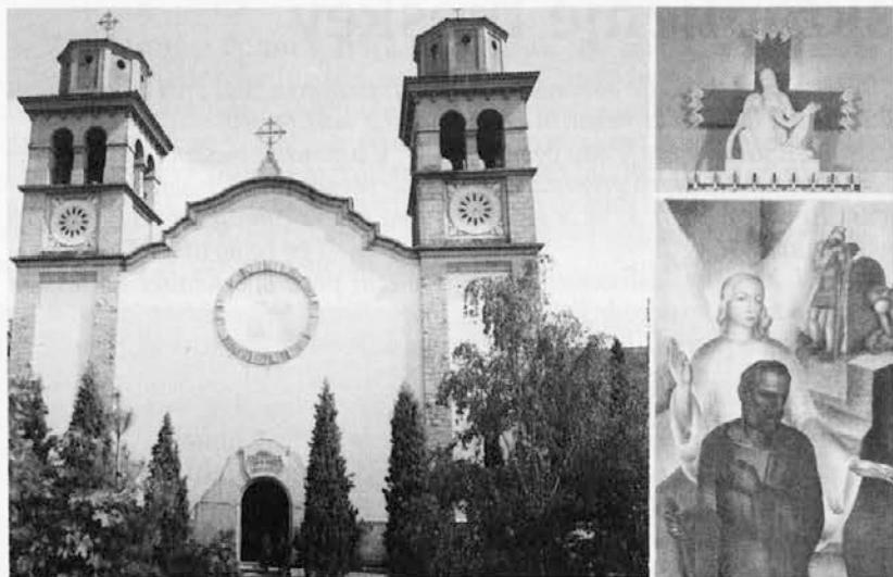
Mirenski Grad: svetišče Žalostne Matere božje