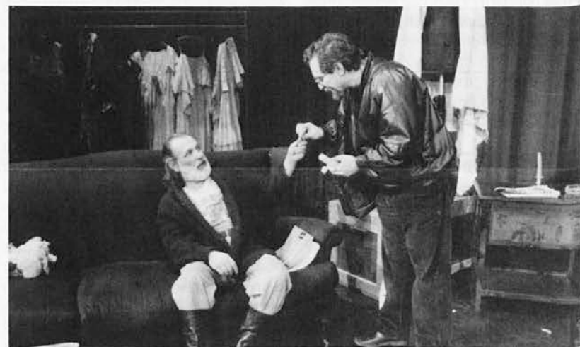
Prizor iz igre Zaklonišče

Odlični sarajevski igralci so navdušili tudi tržaško publiko, ki pa žal, ni bila zelo številna, verjetno predvsem zaradi bojzani, da predstave ne bo razumela.